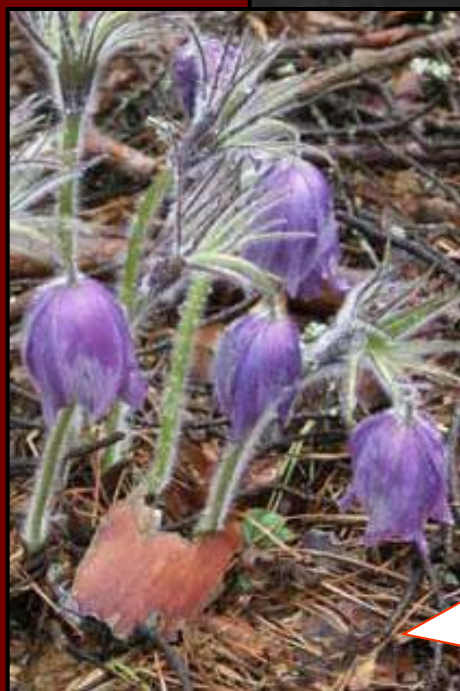
Сон –трава (прострел раскрытый)