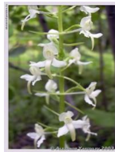
орхидея любка двулистная

Красная книга была учреждена Международным союзом охраны природы в 1966 году. Хранится она в швейцарском городе Морже. В неё заносятся все данные о растениях и животных, которые срочно нуждаются в опеке и защите.