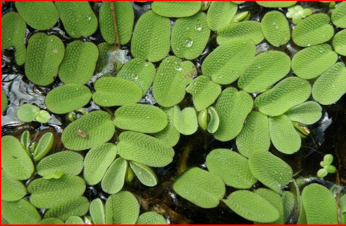
Сальвиния плавающая. Вид находящийся под угрозой исчезновения.