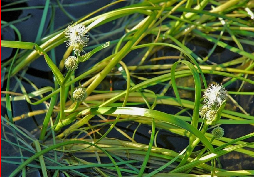
Ежеголовник узколистный. Вид находящийся под угрозой исчезновения В московской области встречается только в 2 озерах.