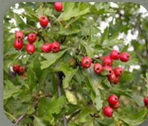
Боярышник Кроваво- красный