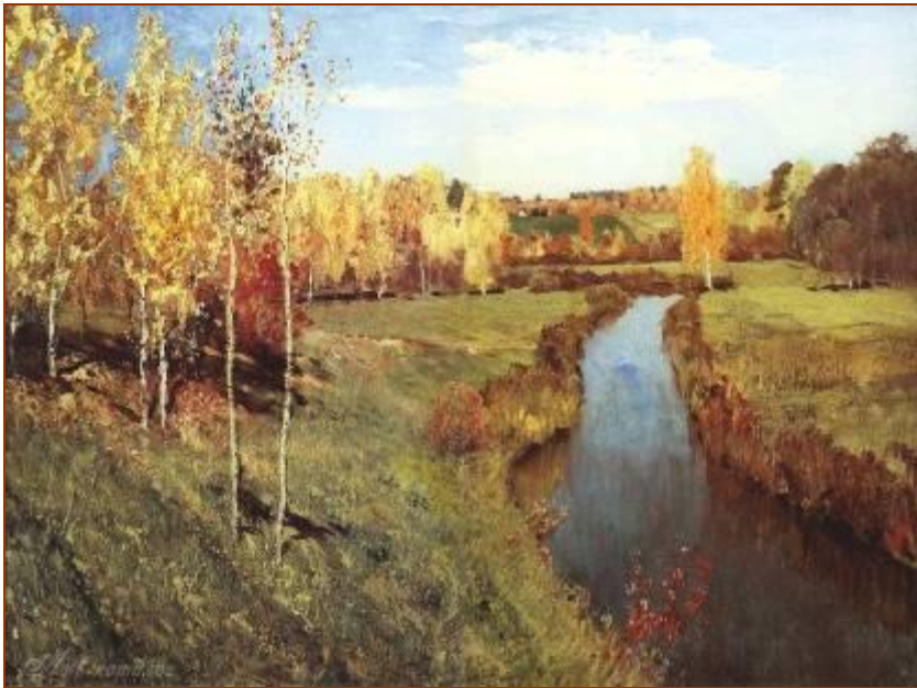
И. Левитан. Золотая осень