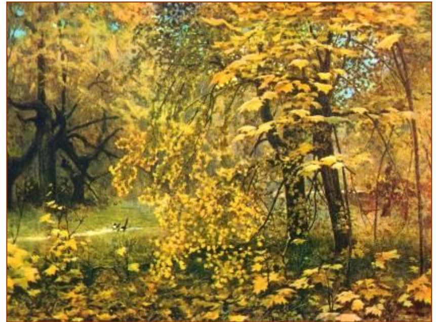
И. Остроухов. Золотая осень