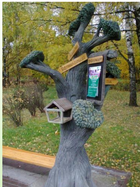
Схема и начало маршрута