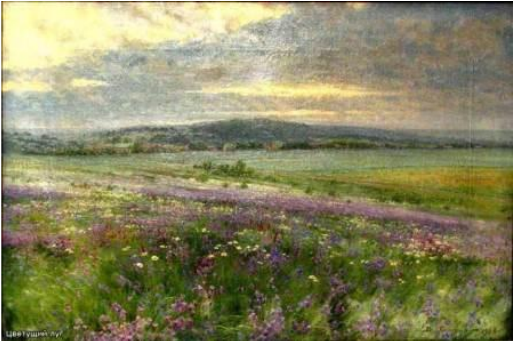
БАТУРИН В.П. «ЦВЕТУЩИЙ ЛУГ»