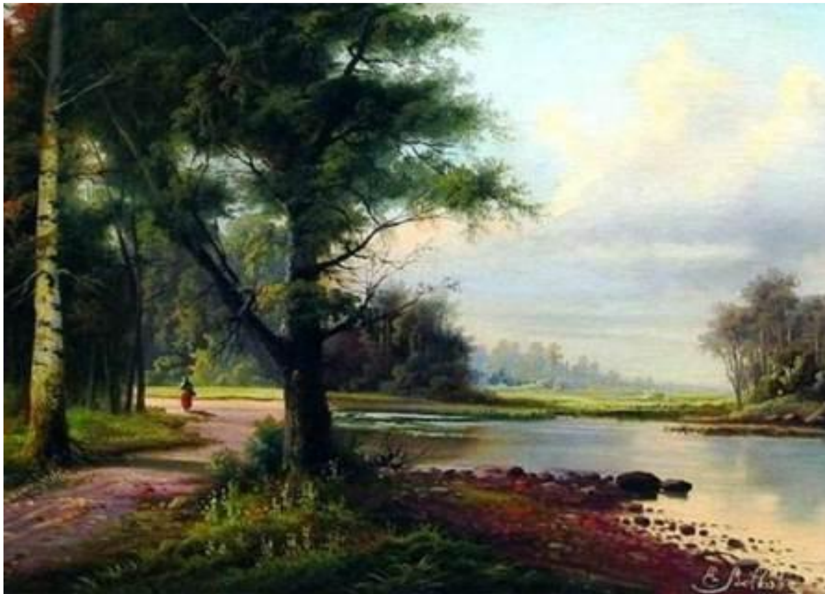
ВОЛКОВ Е.Е. «ПЕЙЗАЖ»