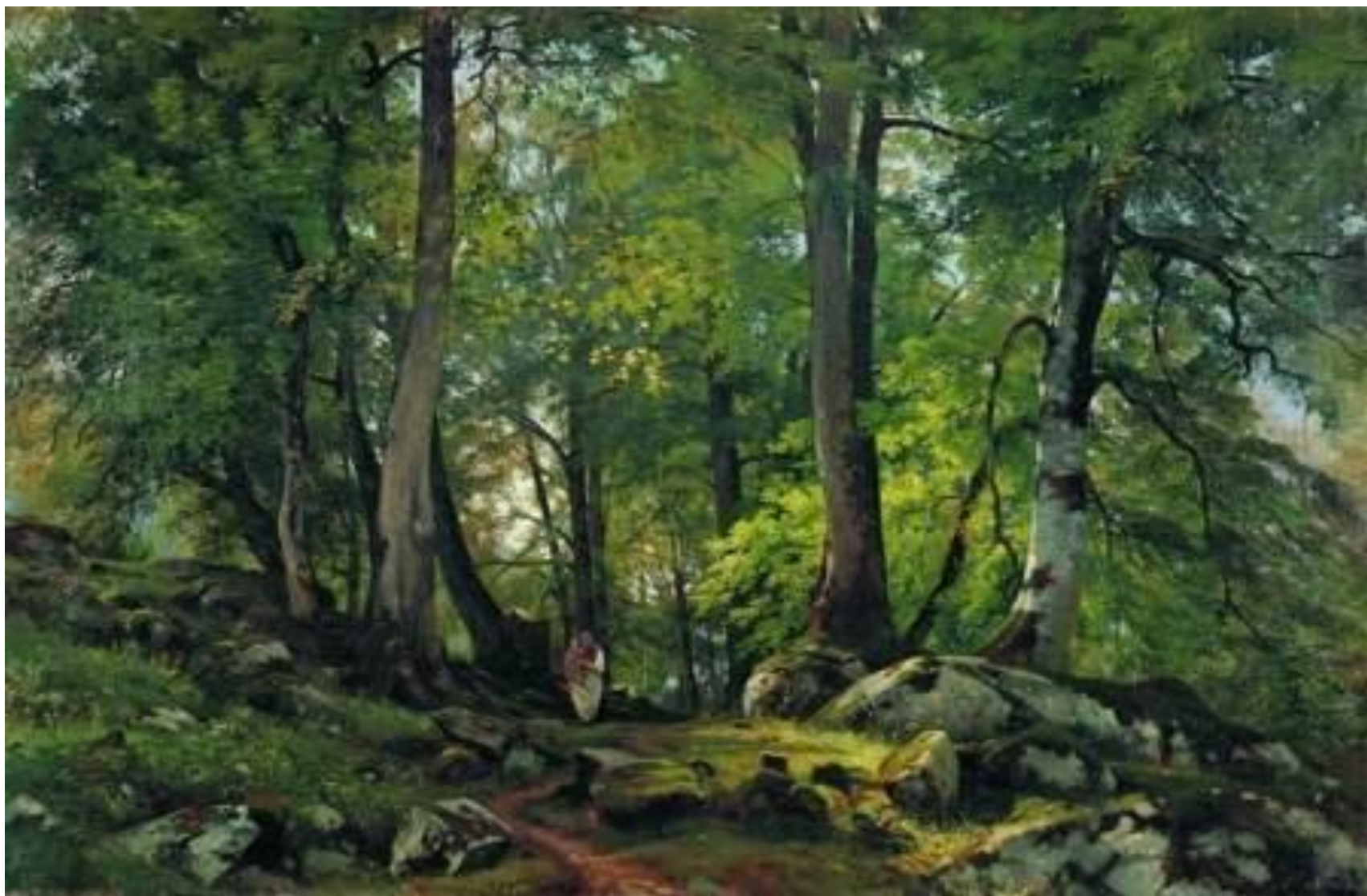
И.И. ШИШКИН «ЛЕС»