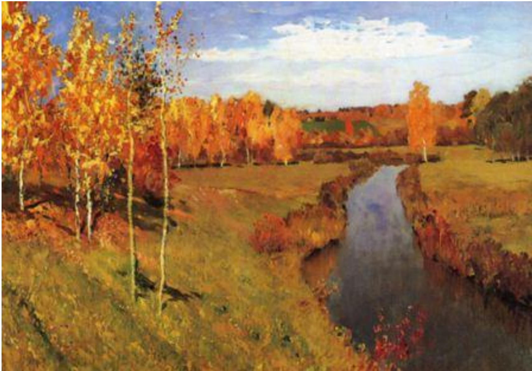
ЛЕНВИТАН И.И. «ЗОЛОТАЯ ОСЕНЬ»