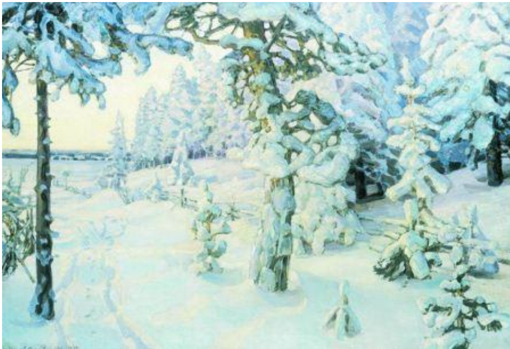
ВАСНЕЦОВ А.М. «ЗИМНИЙ СОН»