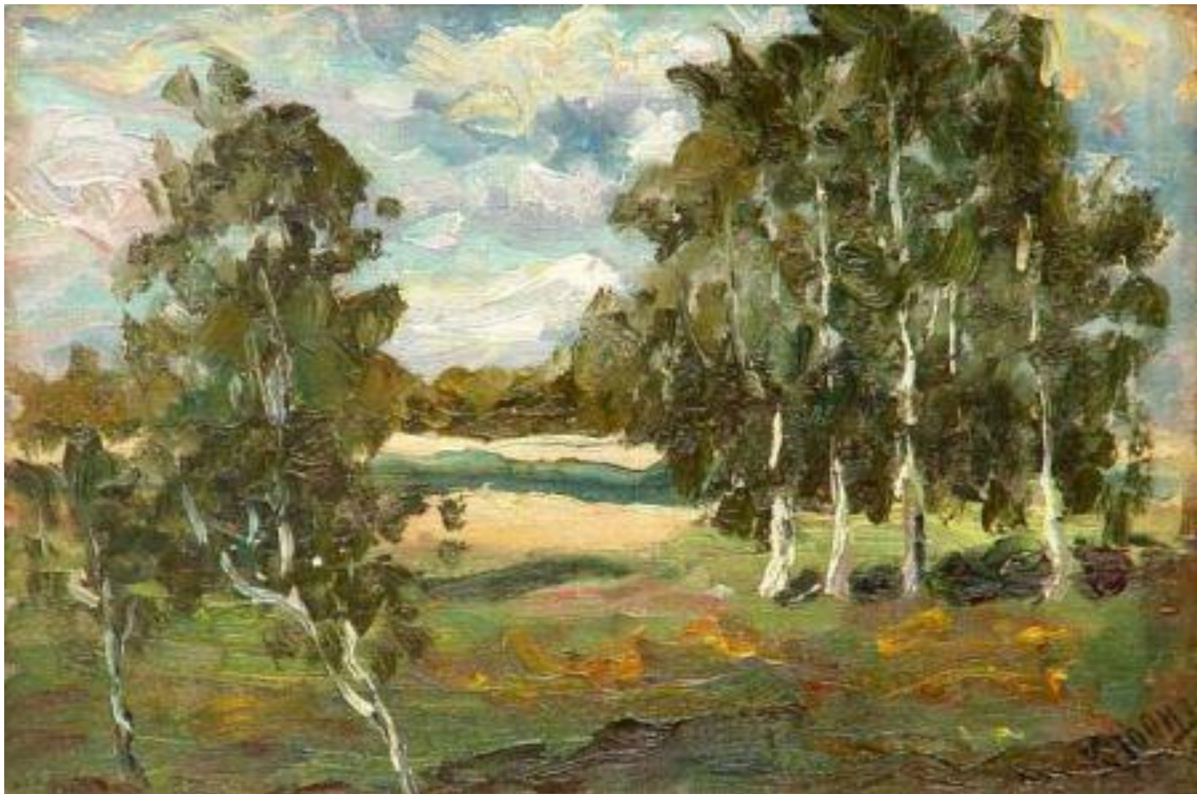
ЮОН К.Ф. «ПЕЙЗАЖ С БЕРЕЗАМИ»