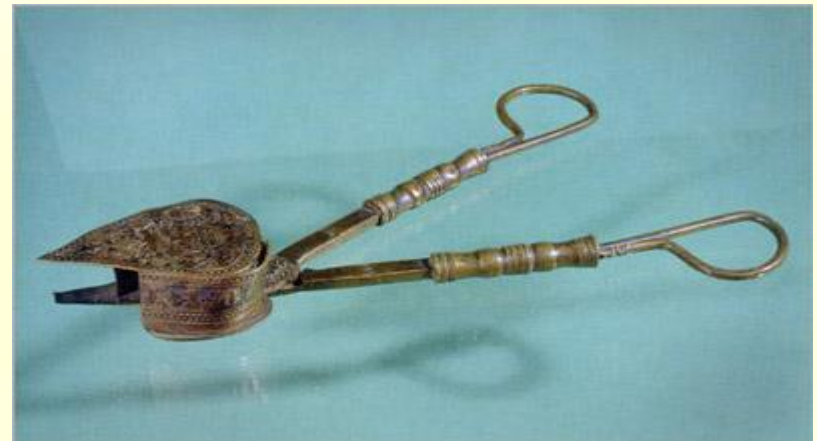
Ножницы для свечей.