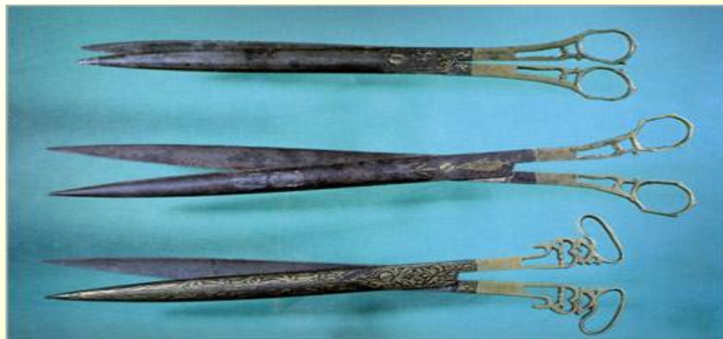
Турецкие древние НОЖНИЦЫ.