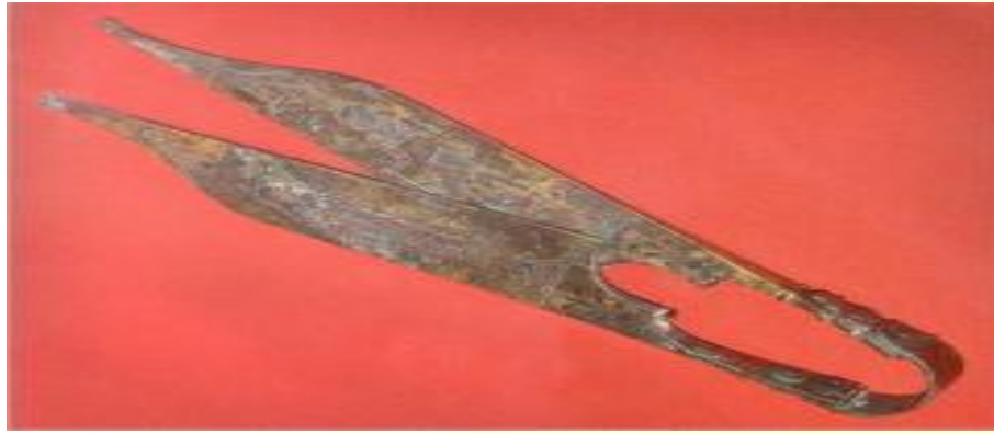
Турция. 2 век нашей зры.