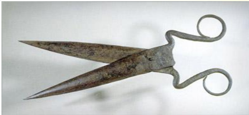
Персидские портняжные. 17 век.