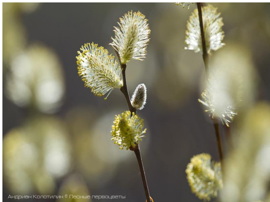
Андрей Колотилин © Лесные первоцветы

ВЕРБА — ЭТО РАЗНОВИДНОСТЬ ИВЫ КОЗЬЕЙ. ПРЕДСТАВЛЯЕТ СОБОЙ ДЕРЕВО ИЛИ КУСТАРНИК СЕМЕЙСТВА ИВОВЫХ С РАЗВЕСИСТОЙ ПОЛУСФЕРИЧЕСКОЙ КРОНОЙ, С ХАРАКТЕРНОЙ ГЛАДКОЙ КОРОЙ СЕРОВАТОГО ЦВЕТА, А НА МОЛОДЫХ ПОБЕГАХ — КРАСНОВАТОГО И ПУШИСТЫМИ СЕРЫМИ ПОЧКАМИ. ВЕРБА ИМЕЕТ УЗКИЕ ЛАНЦЕТНЫЕ, ПРОДОЛГОВАТЫЕ И ГЛАДКИЕ НА ОЩУПЬ ЛИСТЬЯ С ОСТРОПИЛЬЧАТЫМИ КРАЯМИ. ЦВЕТЕНИЕ ОБЫЧНО ДЛИТСЯ С АПРЕЛЯ ПО МАЙ ДО РАСПУСКАНИЯ МОЛОДЫХ ЛИСТЬЕВ. ВЕТОЧКИ — ПЛАСТИЧНЫЕ, ГИБКИЕ, И, БЛАГОДАря СВОЕМУ СВОЙСТВУ, ДОВОЛЬНО ЧАСТО ЯВЛЯЮТСЯ КАРКАСНЫМ И КОНСТРУКЦИОННЫМ МАТЕРИАЛОМ. КУСТАРНИК ШИРОКО ИСПОЛЬЗУЮТ ВО ФЛОРИСТИКЕ. ВЕРБА — НЕОТЪЕМЛЕМО ТРАДИЦИОННАЯ ЧАСТЬ ПАСХАЛЬНЫХ И ВЕСЕННИХ КОМПОЗИЦИЙ.