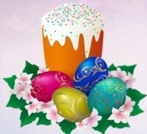
Картинки, фотографии пасхи, куличей, раскрашенных яиц.