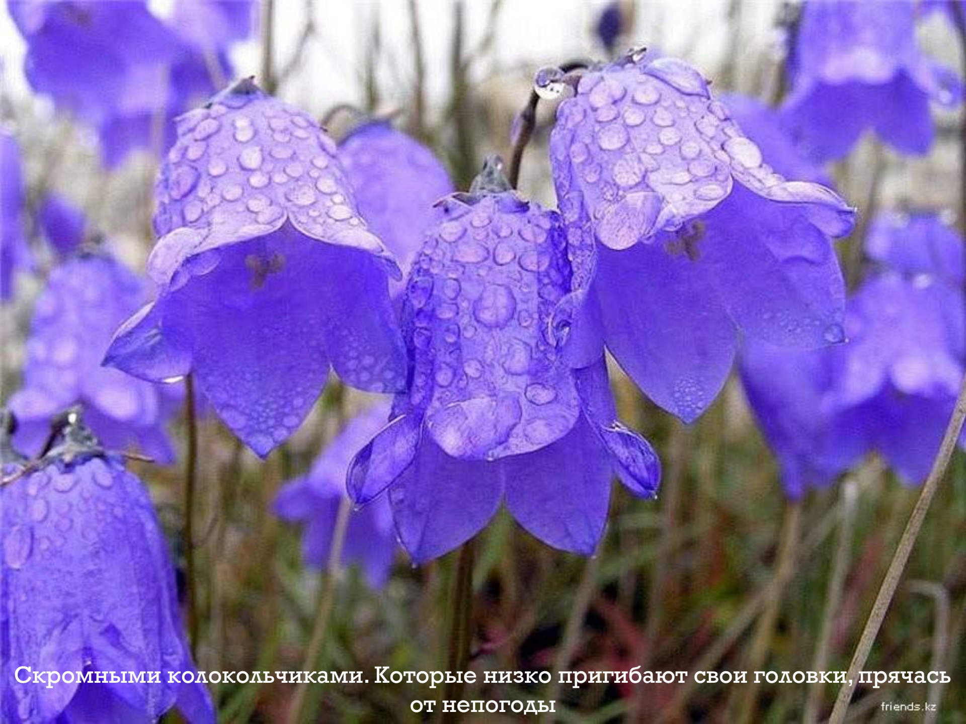
Скромными колокольчиками. Которые низко пригибают свои головки, прячась от непогоды