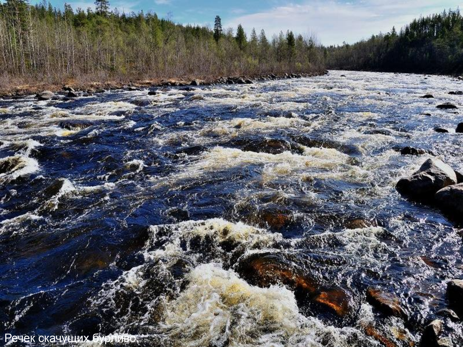
Речек скачуцих бурливо.