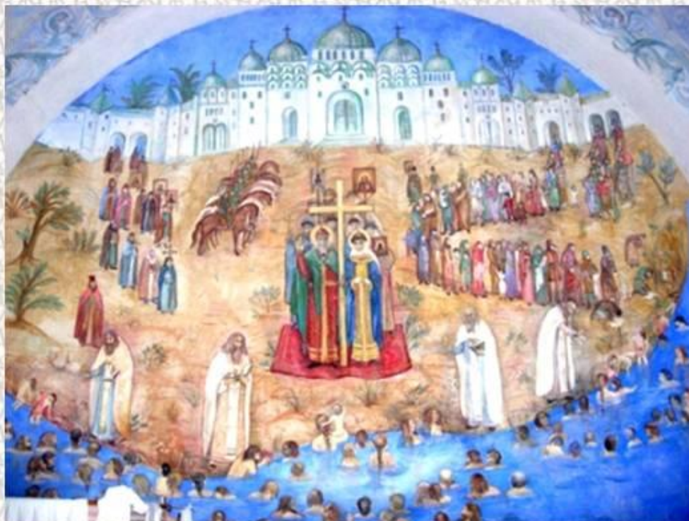
Фреска «Крещение Руси»

Вот как описывает это событие «Повесть временных лет»: «Сошлось там людей без числа. Вошли в воду и стояли там одни до шеи, другие по грудь, молодые же у берега по грудь, некоторые держали младенцев, а уже взрослые бродили, попы же совершали молитвы, стоя на месте. И была видна радость на небе и на земле по поводу стольких спасаемых душ».