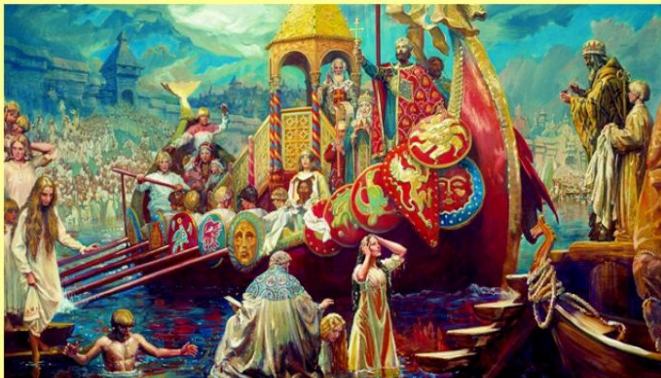
Фрагмент репродукции картины Михаила Шанькова "Крещение Руси"

Владимир объявил христианство государственной религией.