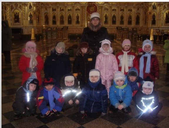
Свято-Федоровский кафедральный собор в честь св. Феодора Ушакова