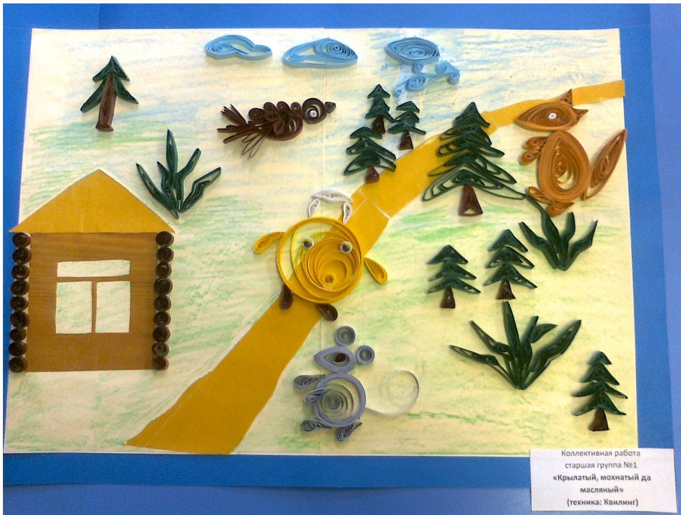
Коллективная работа старшая группа №1 «Крылатый, мохнатый да масляный» (техника: Квиллинг)

Коллективная работа по сказке в технике: «Квиллинг»