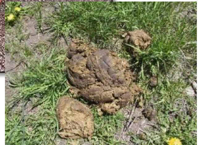
Навоз животных используют как удобрение для выращивания растений