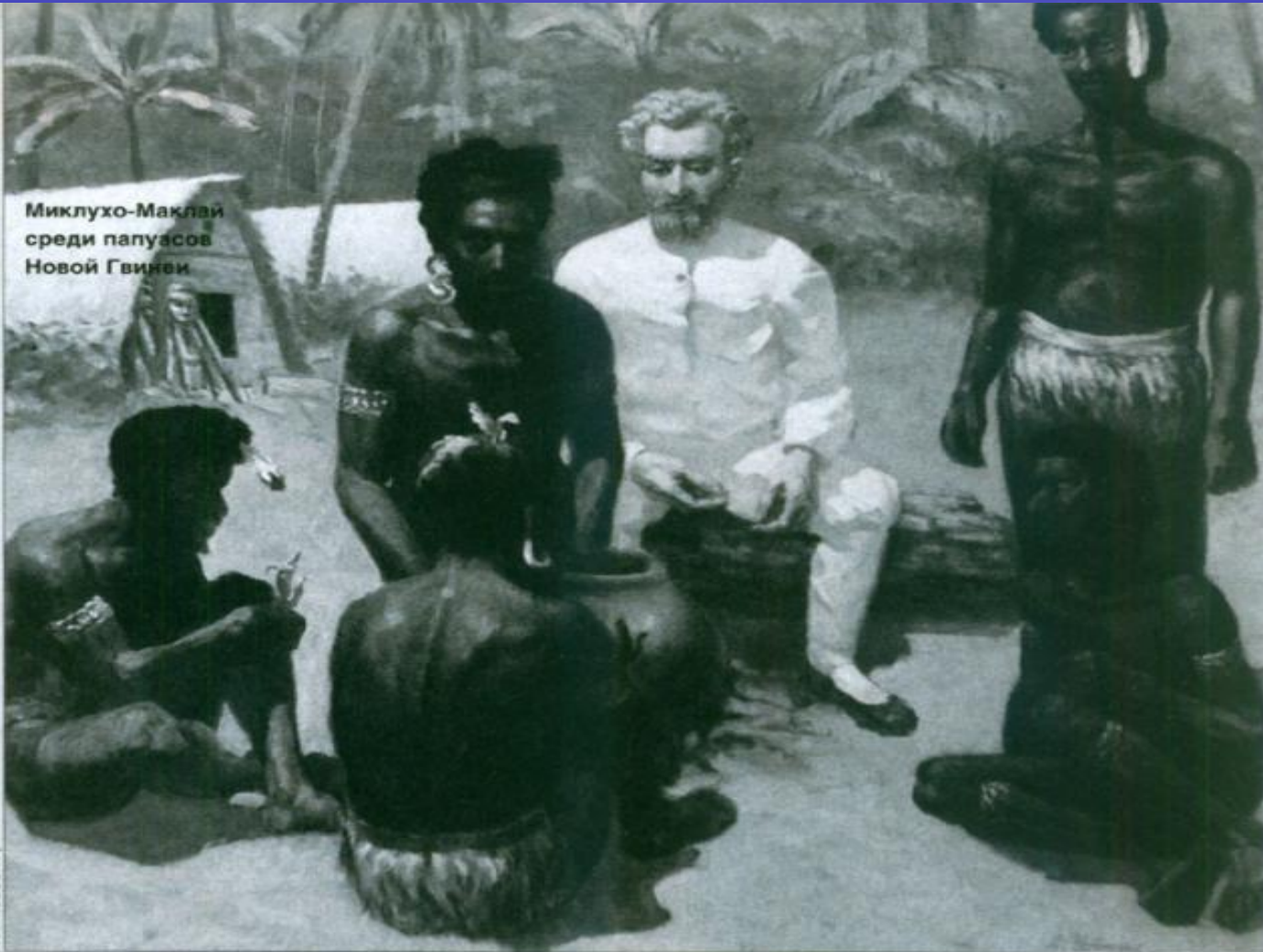
Миклухо-Маклай среди папуасов Новой Гвинеи