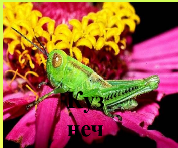
С веч ик