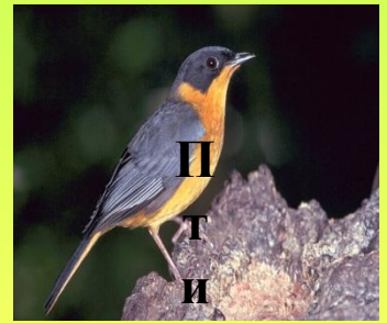
П т и ц а