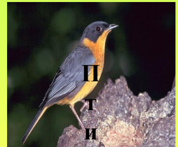
П т и ц а