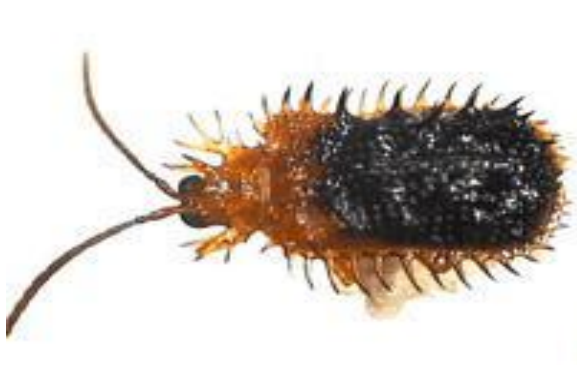
Indet. Hispinae (Chrysomelidae)