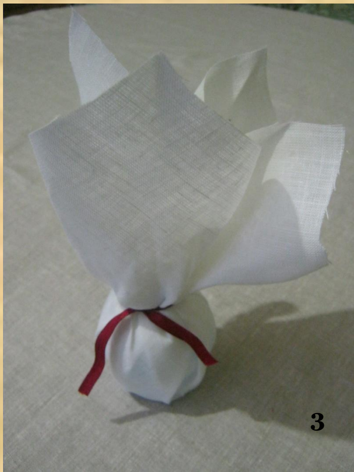
Лентой формируем талию куклы