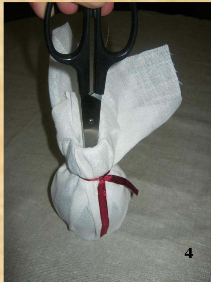
Края ткани заправляем в горлышко бутылки ножницами