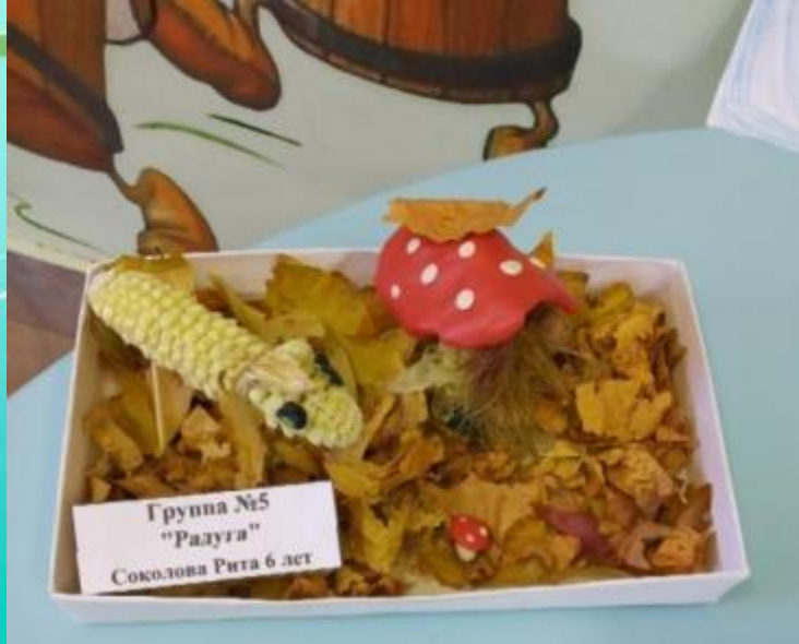
Группа №5 "Раздуга" Соколова Рита 6 лет