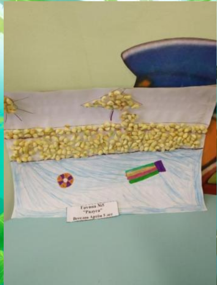
Группа №8 "Радуга" Бережко Артём 5 лет