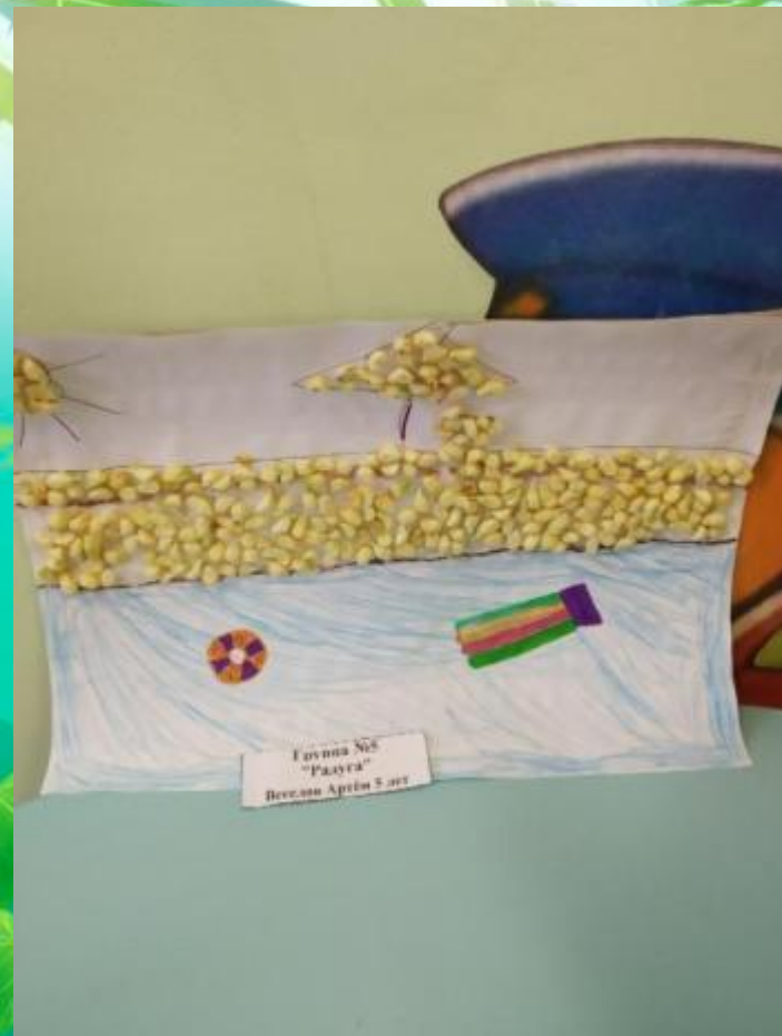
Группа №8 "Радуга" Бережко Артём 5 лет