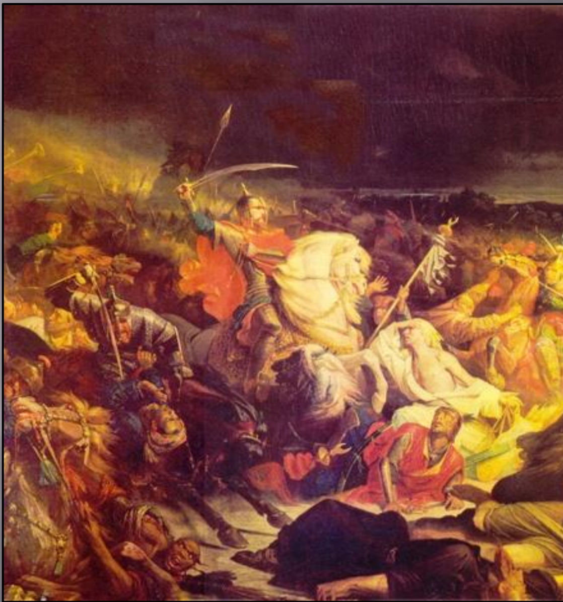
Куликовская битва. Адольф Ивон.