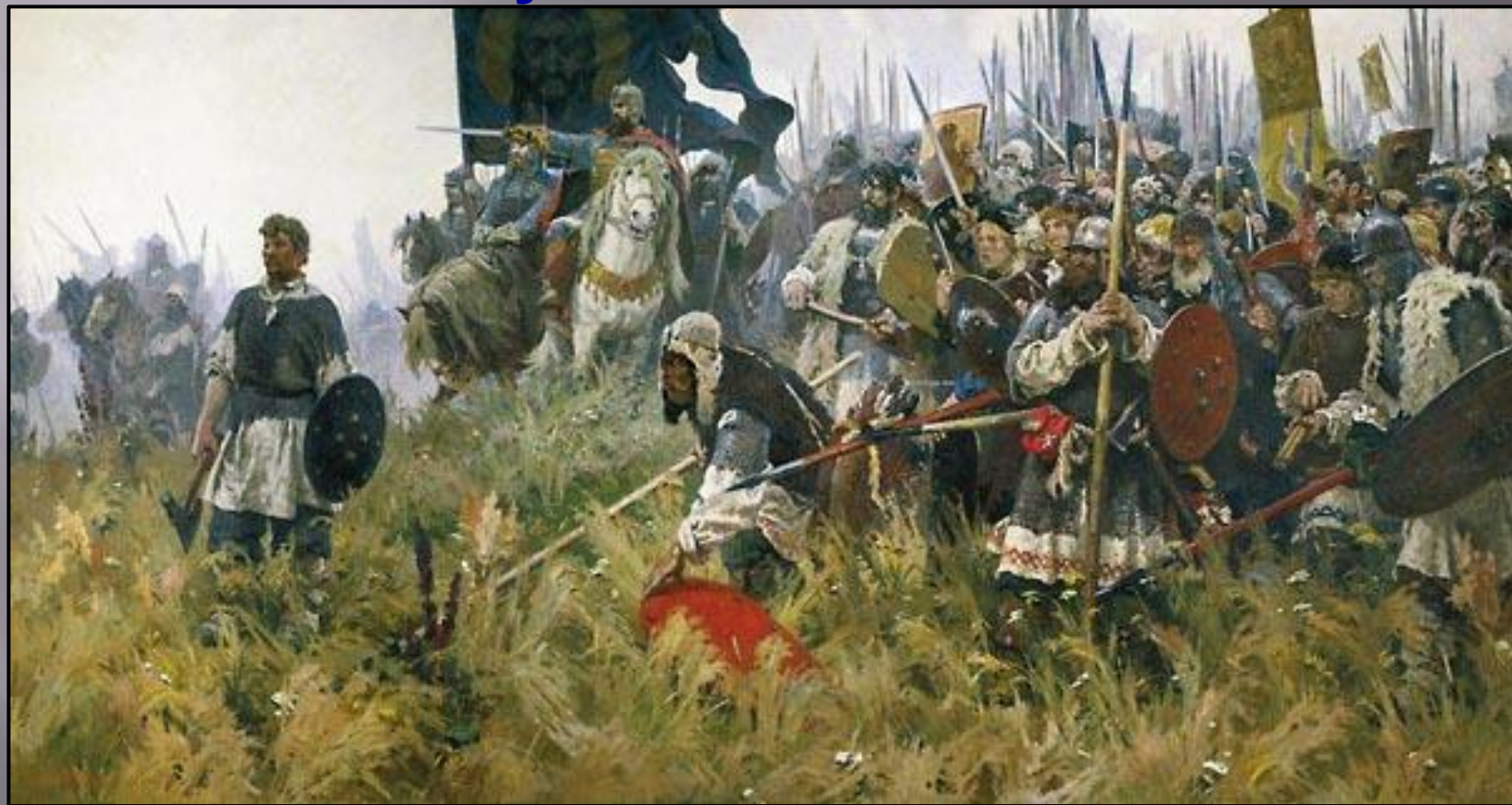
Утро на Куликовом поле. А.Бубнов. 1943-1947 гг.

Утром 8 сентября русские переправились через Дон и под прикрытием сторожевого полка развернулись в боевой порядок на Куликовом поле.