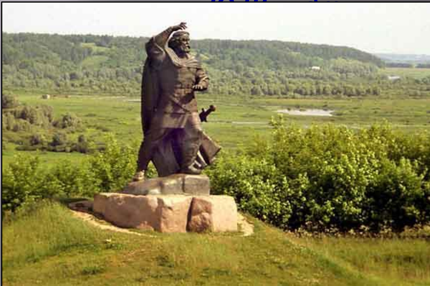
Памятник на Куликовом поле

В памяти потомков сохранится вечно, Куликово поле да Непрядва-речка.