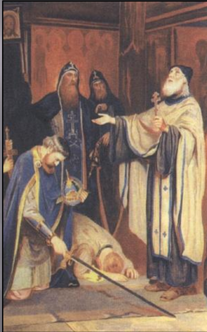
Преподобный Сергий благословляет Дмитрия на борьбу с Мамаем. Худ. А. Н. Новосколецев