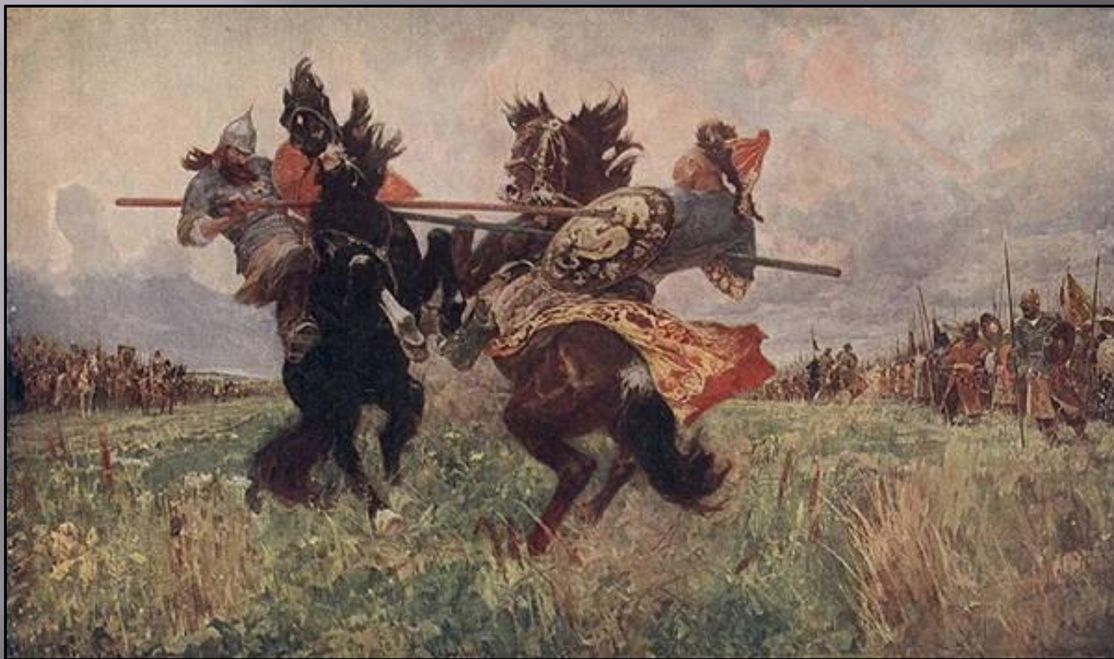
Поединок Пересвета с Челубеем. М. Авилов. 1943 г.

Сражение началось поединком Пересвета с ордынским богатырём Челубеем. В результате сражения оба они погибли.