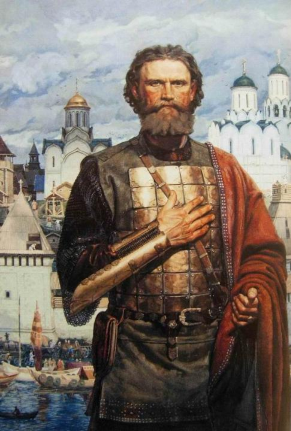
Дмитрий Иванович внук Ивана Калиты