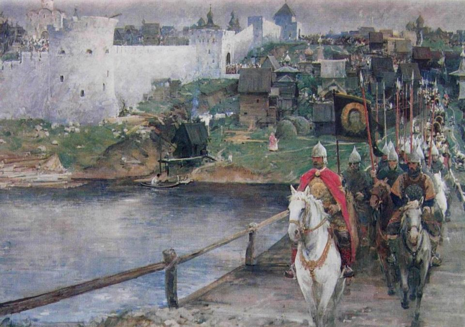
ВЫХОД РУССКОГО ВОЙСКА ИЗ МОСКВЫ