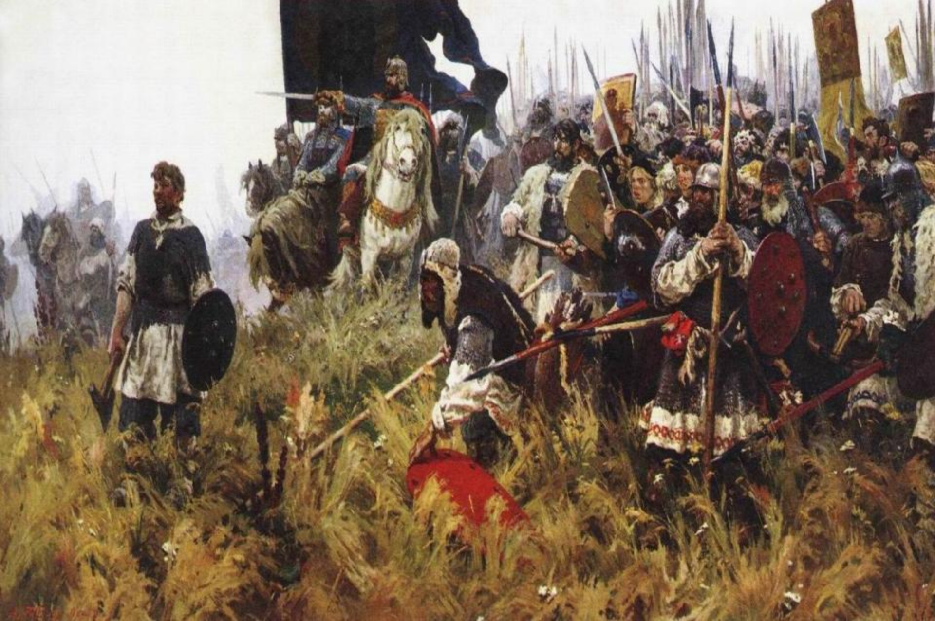
Утро на Куликовом поле