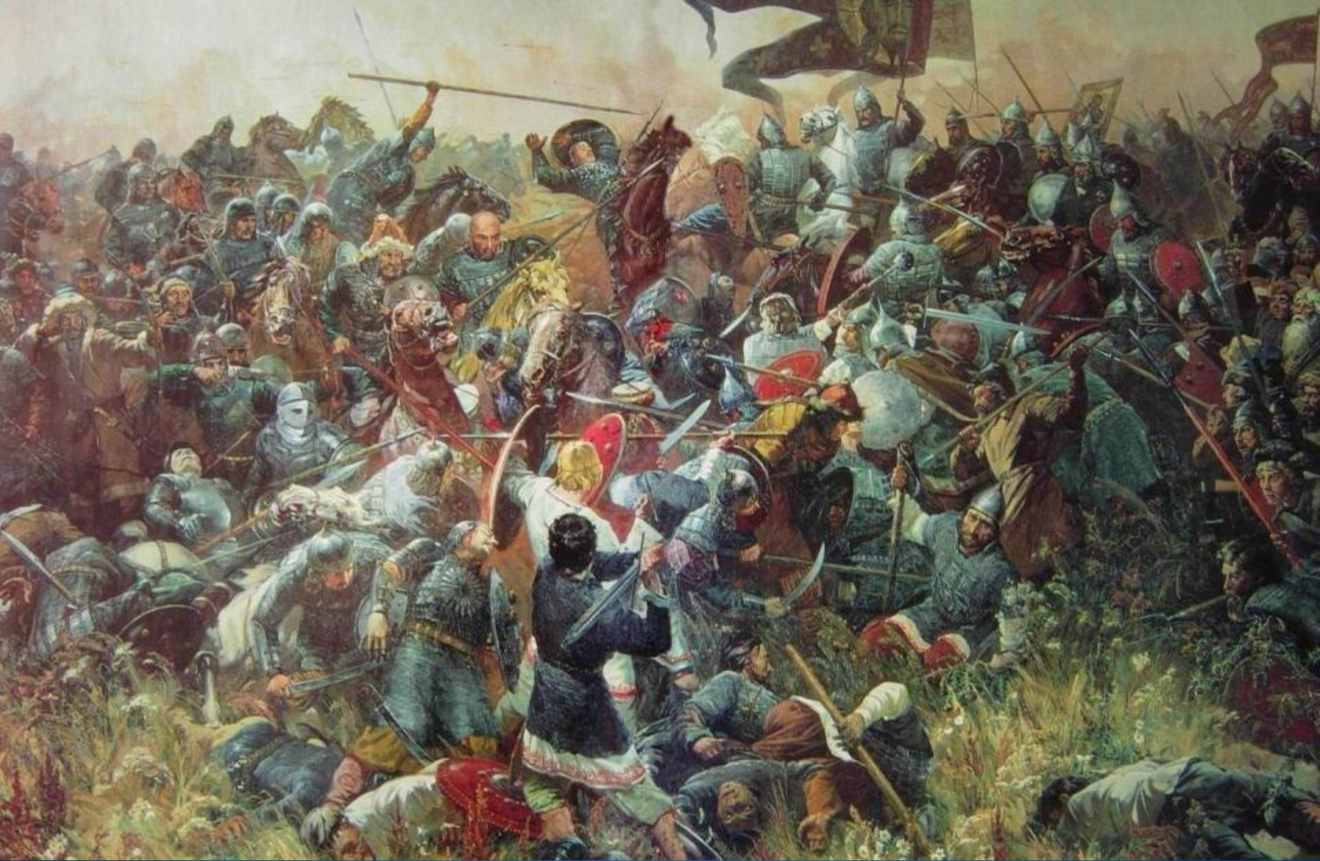
Натиск татар на большой полк