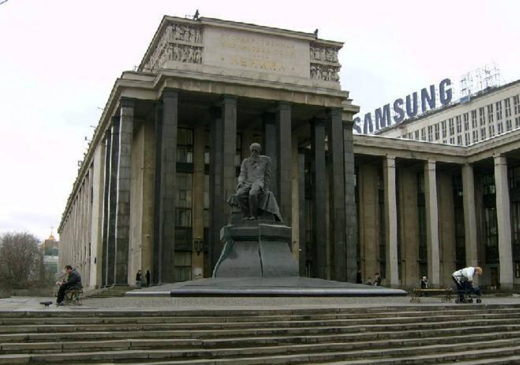
Библиотека имени Ленина