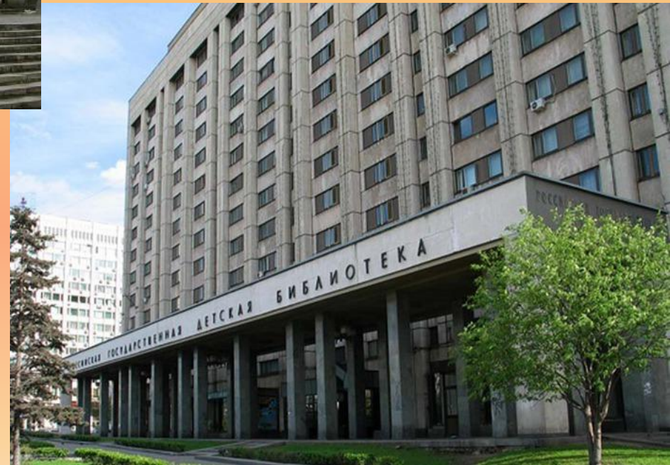
Российская Государственная детская библиотека