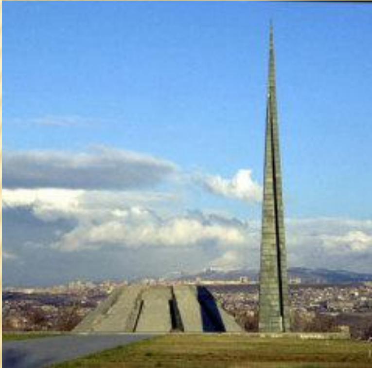
Памятник «Памяти жертв Геноцида армян»