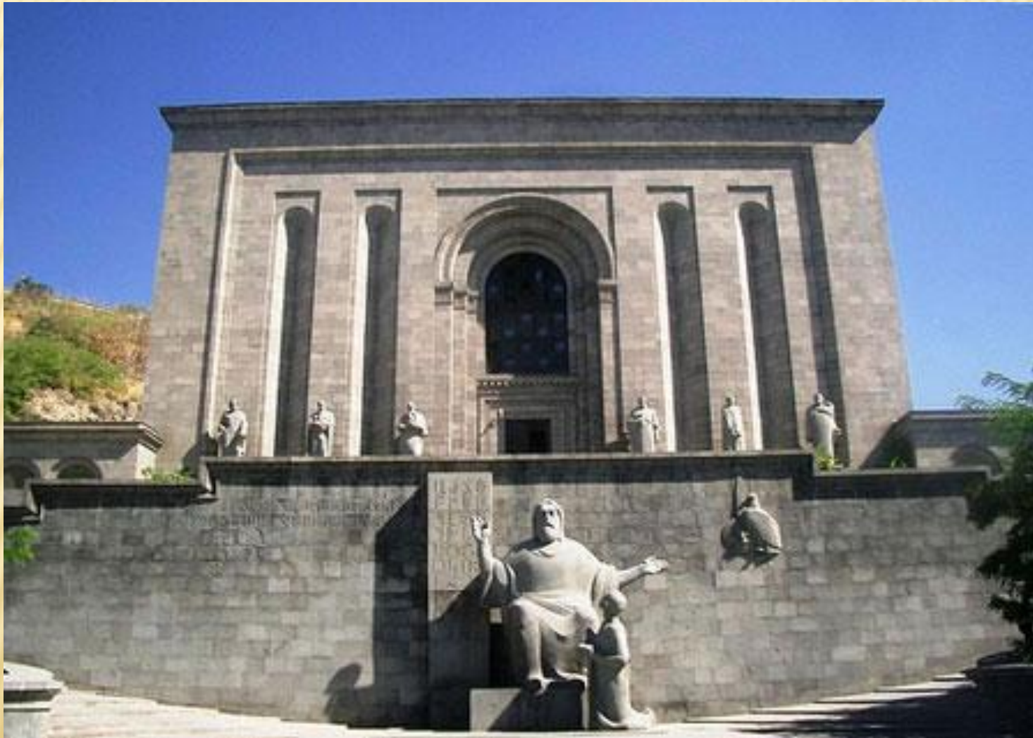
Матенадаран имени Месропа Маштоца