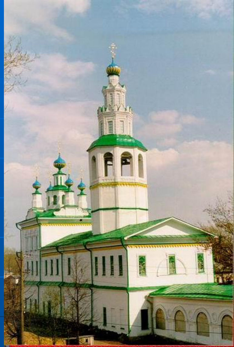
Церковь за Сылвой