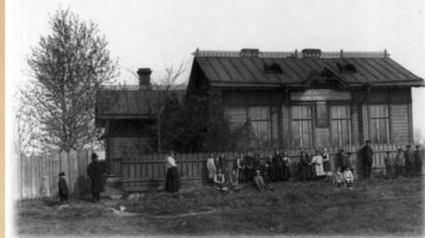
Купчинская земская школа Петербургской земской управы

К началу XX века в деревне было две улицы. Население деревни занималось в основном животноводством, огородничеством и извозом. В деревне имелись: школа, читальня, кузница, пожарное депо, где дежурили члены добровольной дружины. В 1909 году жителями деревни был заложен собственный храм .