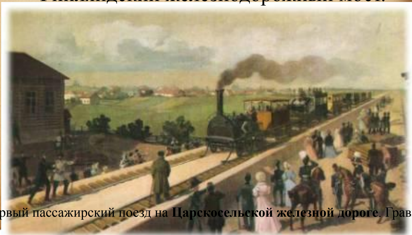
Первый пассажирский поезд на Царскосельской железной дороге. Гравюра.