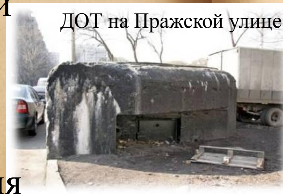
ДОТ на Празжской улице