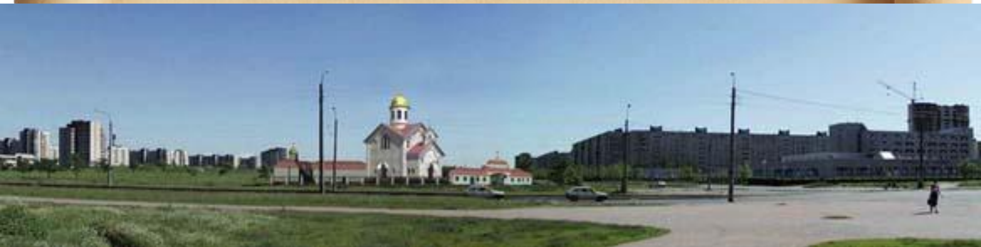
Храм Серафима Вырицкого

Параллельно активизируется и религиозная жизнь. В 2002 и 2005г.г. в Купчино появилось два новых православных храма, построенных в честь Георгия Победоносца и Серафима Вырицкого.