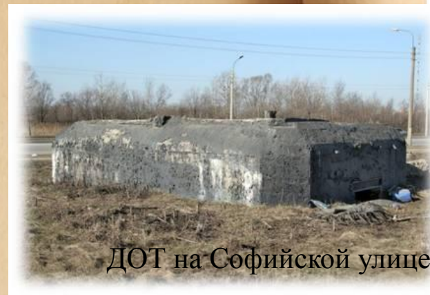
ДОТ на Софийской улице

В годы ВОВ деревня Купчино эвакуируется. Жилые дома, за исключением трёх, оставленных для военных целей, разобрали для постройки военных укреплений и на дрова. В первые месяцы блокады с Витебского вокзала в специальных поездах жители города отправлялись в район Купчино для возведения оборонительных сооружений.