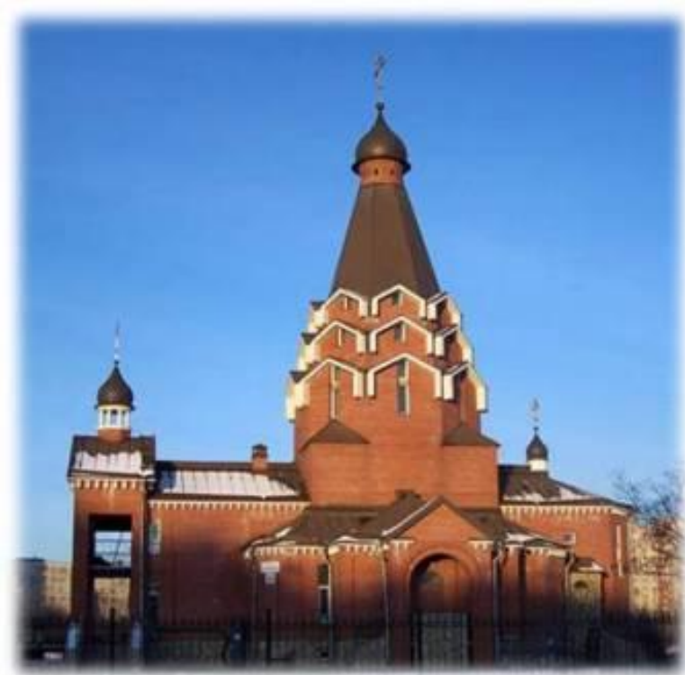
Храм Георгия Победоносца

Параллельно активизируется и религиозная жизнь. В 2002 и 2005г.г. в Купчино появилось два новых православных храма, построенных в честь Георгия Победоносца и Серафима Вырицкого.