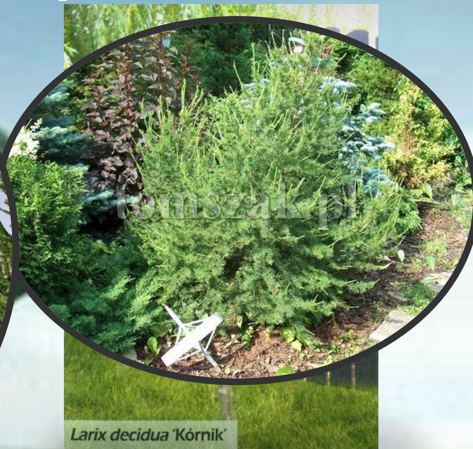
Larix decidua 'Kornik'