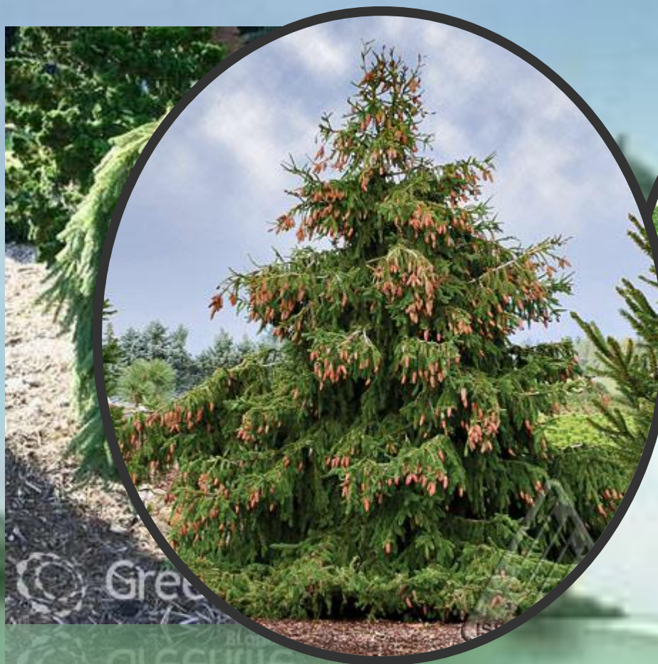
Литвенница европейская «Корник»