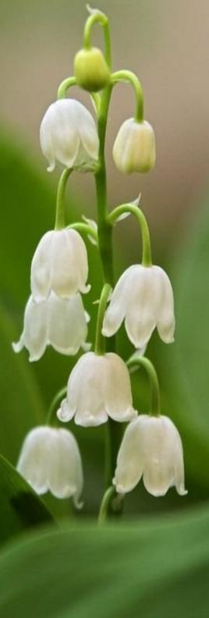
Пасхальная Открытка 1910-е годы