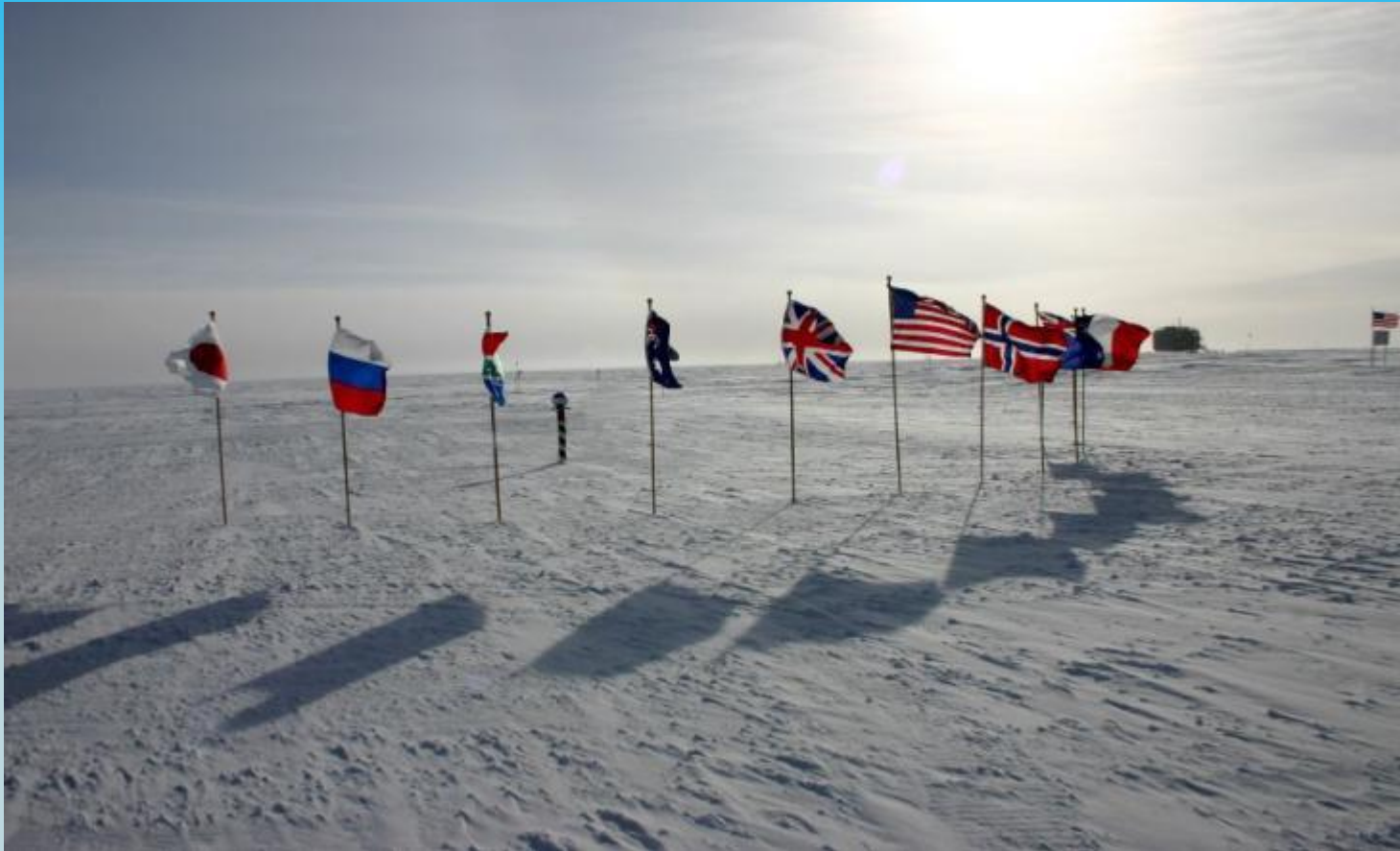
Флаги стран, подписавших Договор об Антарктиде.

Антарктида не принадлежит ни одному государству. Разрешена только научная деятельность.