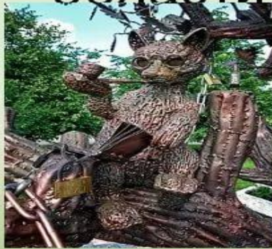
Памятник ученому коту (г. Кировск)