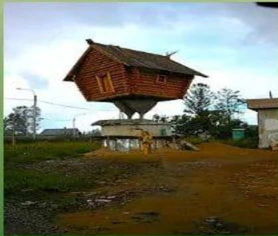
Домик Бабы Яги (п. Ульяновка)