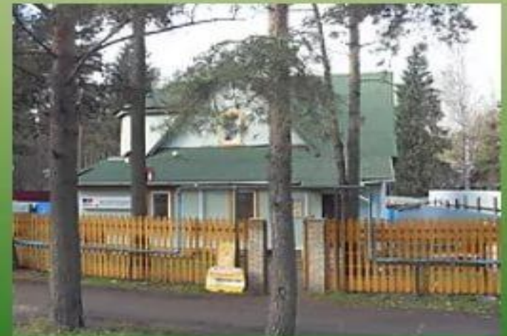
Музей кошки (г. Всеволожск)