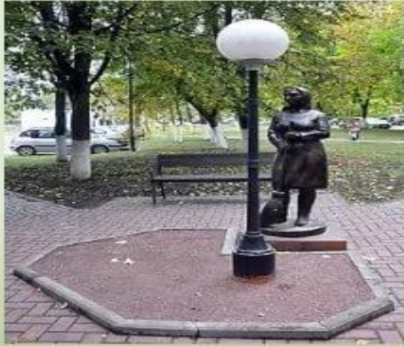
Памятник дворнику (г. Кировск)