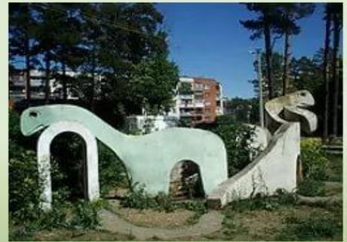
Памятник динозаврам (г. Сосновый Бор)