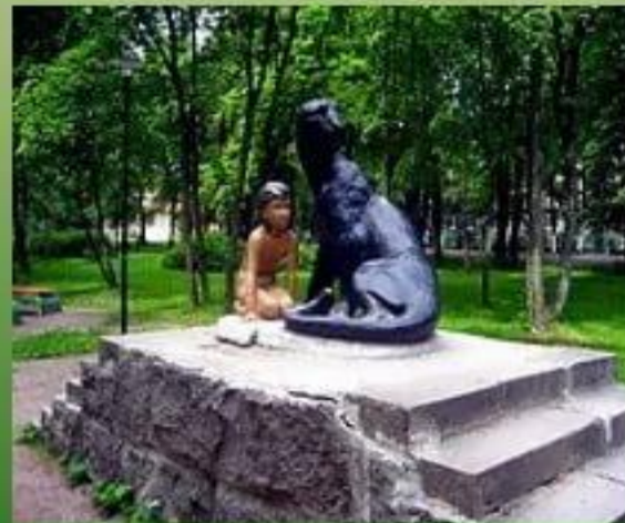
Маугли (г. Приозерск)