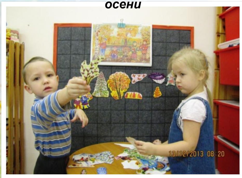
Дидактическая игра: Приметы осени