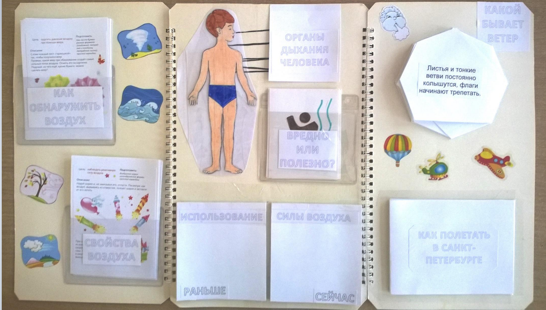
Лэпбук представляет собой двухстороннюю папку-раскладушку. Содержание папки может быть изменено в соответствии с возрастом и потребностями детей.