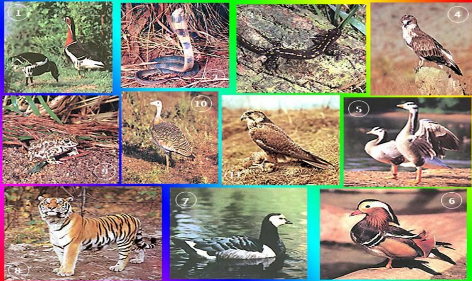
Редкие виды животных, занесенные в Красную книгу. 1 — краснозобая казарка; 2 — среднеазиатская кобра; 3 — кавказская саламандра; 4 — змееед; 5 — горный гусь; 6 — мандаринка; 7 — белощекая казарка; 8 — амурский тигр; 9 — камышовая жаба; 10 — дрофа; 11 — балобан.