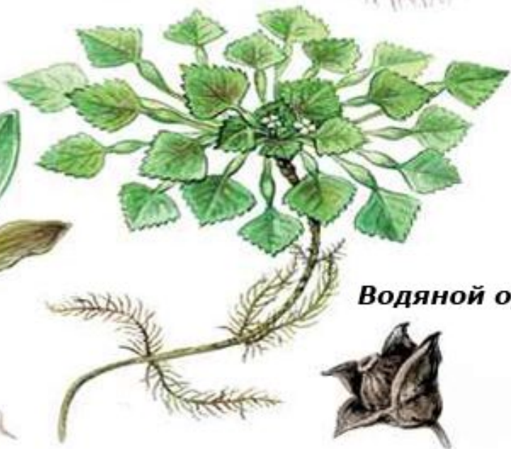
Водяной орех, или чилим