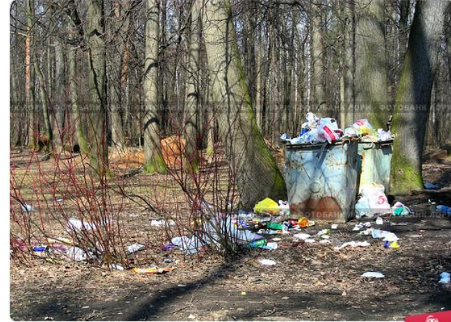
Москва. Свалка мусора в лесу "Лосиный остров".