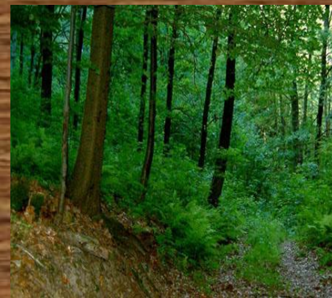
Широколист -венный лес