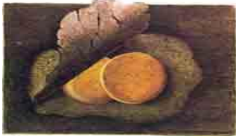
Два приоткрытых яйца