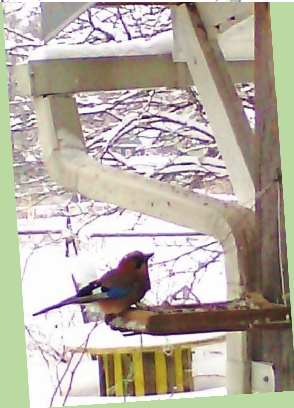
ФОТО С сойкой