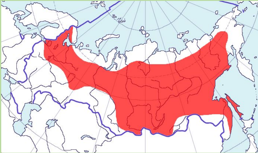
Карта: распространение сойки на территории России