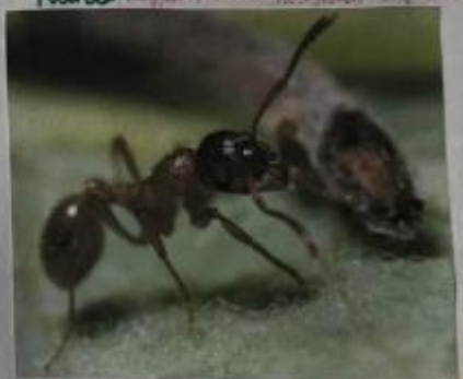
Рама (редко встречается)