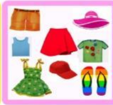
ЧТО ОДЕВАЮТ ЛЮДИ?