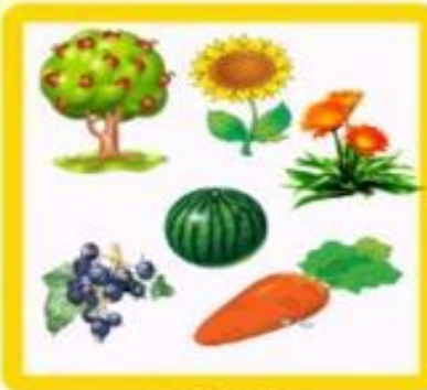
КАКОВ РАСТЕНИЕЛЮБНЫЙ МИР?