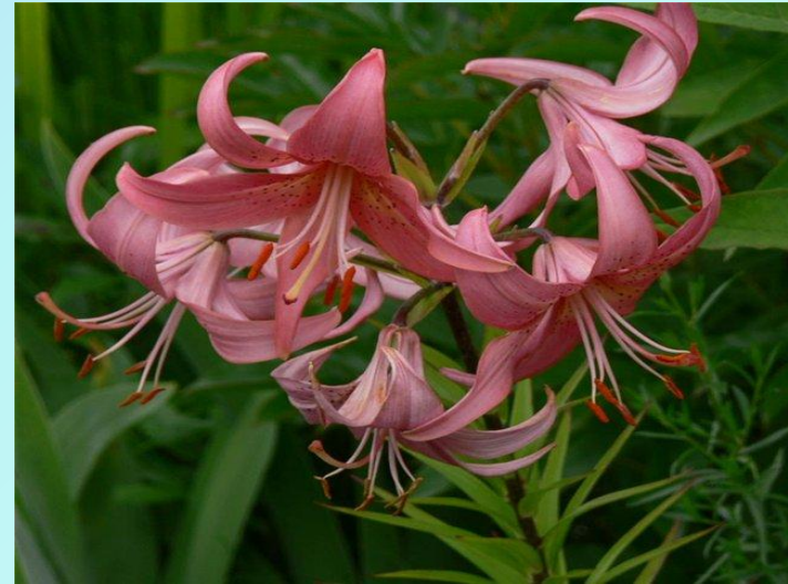
Чалмовидные, листья сильно изогнуты наружу