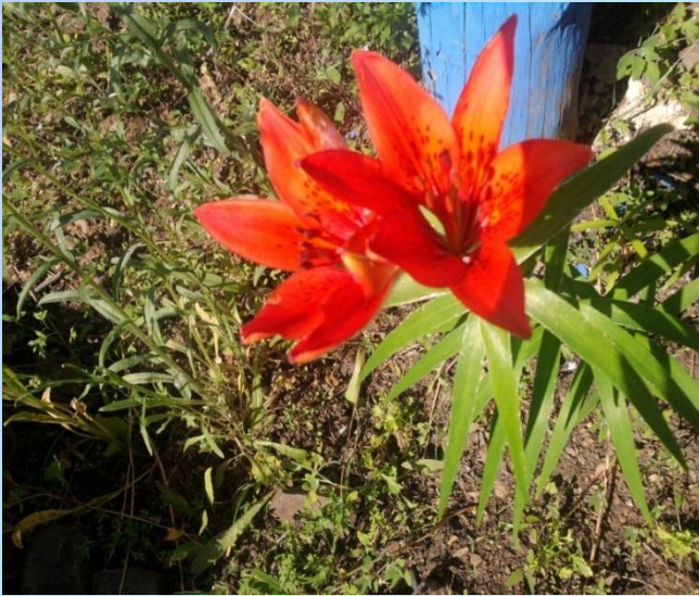
Коронковидные, листья слегка изогнуты