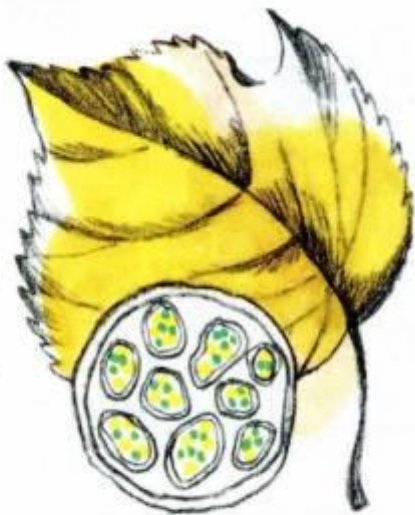
Осенью зелёные зёрна хлорофилла разрушаются, а жёлтый пигмент сохраняется. Листья желтеют.

С наступлением осени дни становятся короче, зелёные зёрна хлорофилла разрушаются и заметным становится жёлтый цвет или красный. Это зависит от того, какое красящее вещество находится в вянущем листе.