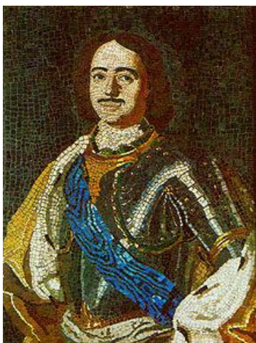
Портрет Петра I. Мозаика.

Набрана М. В. Ломоносовым. 1754г Эрмитаж