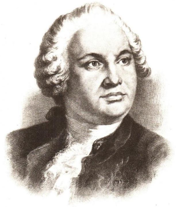
Михаил Васильевич ЛОМОНОСОВ (1711—1765)

Михаил Васильевич Ломоносов родился в 1711 году в деревне Денисовка около села Холмогоры Архангельской губернии, в семье крестьянина- помора, занимавшегося морским промыслом на собственных судах.