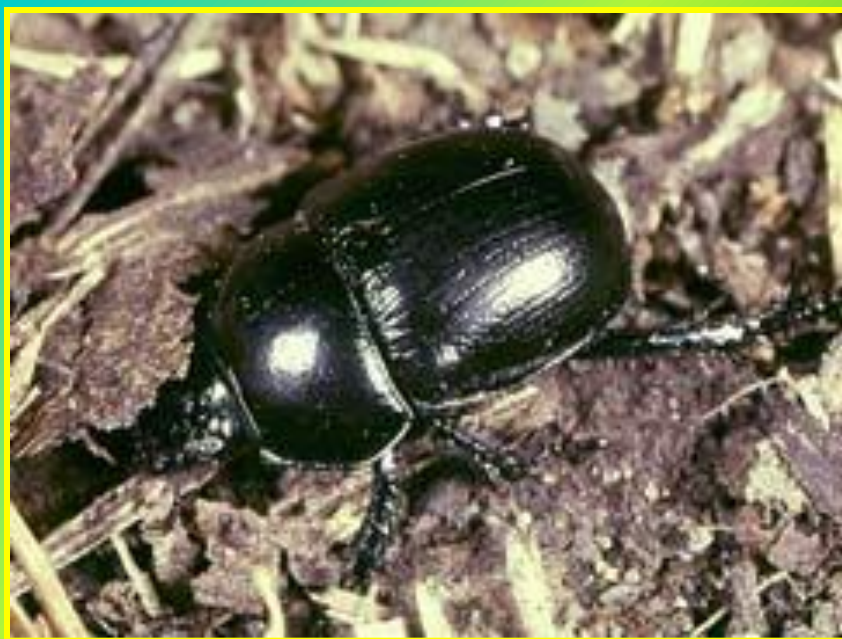
Жук - навозник