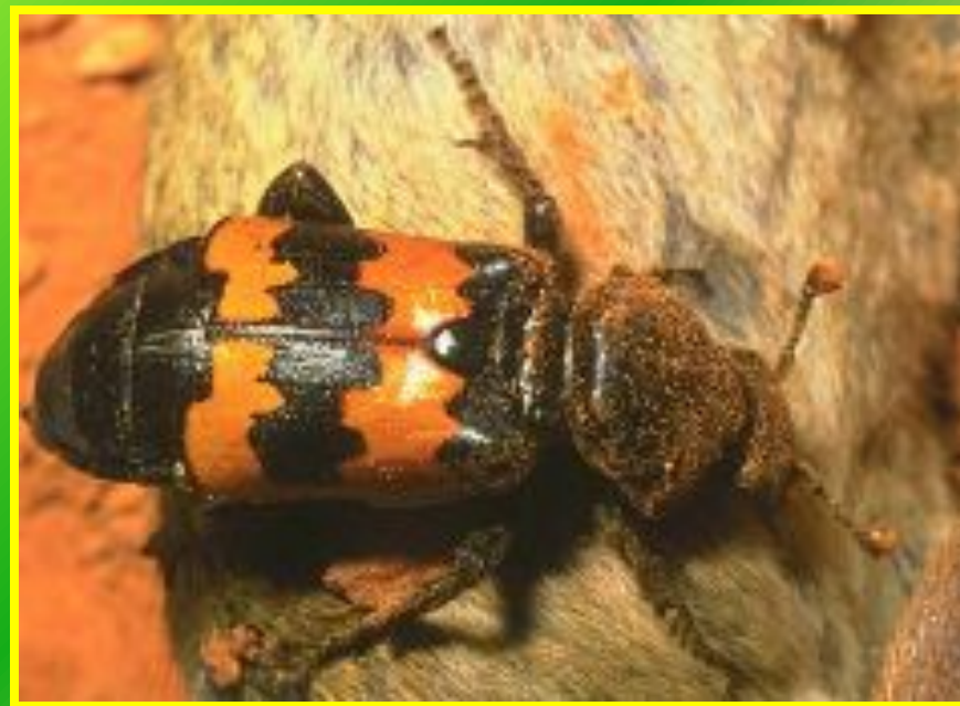
Жук - могильщик