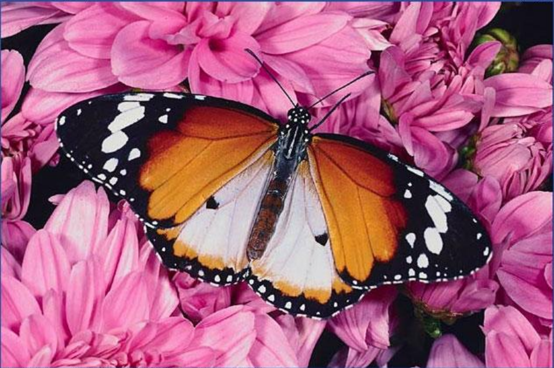
Бабочка семейства данаид ( Danaus genutia ).