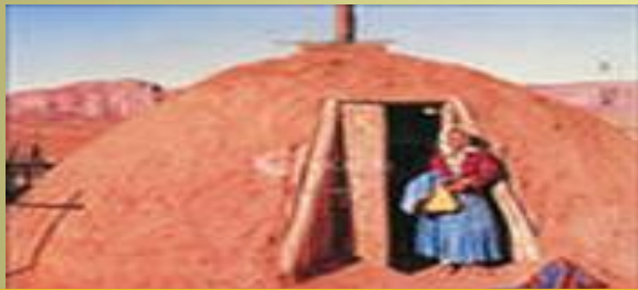
Песчаный индийский дом