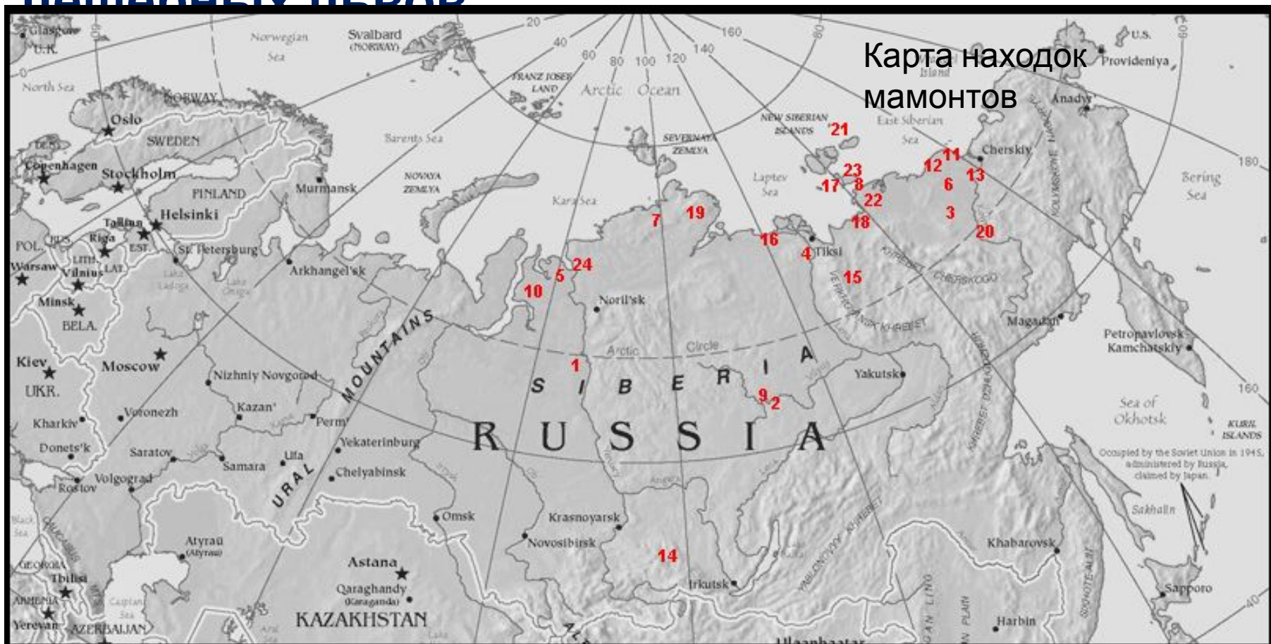
Карта находок мамонтов