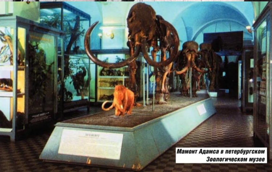
Мамонт Адамса в петербургском Зоологическом музее

в 1808 году впервые в мире был смонтирован полный скелет мамонта — мамонта Адамса. В настоящее время он экспонируется в экспозиции музея Зоологического института РАН в г. Санкт-Петербурге.