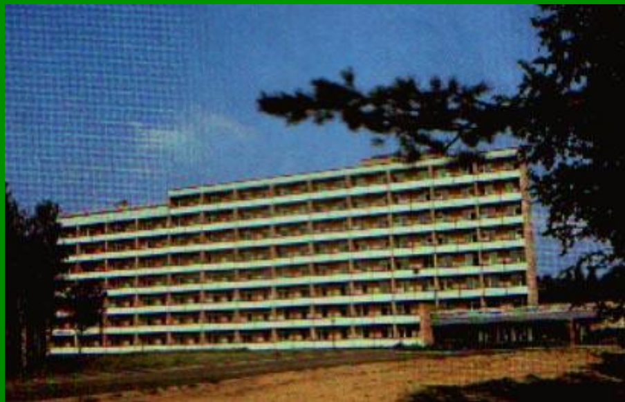
МОУ "Красногорская СОШ №2" Марий Эл, п.

Санаторий обеспечен всем необходимым современным медицинским оборудованием, имеются также клуб, кинозал, библиотека, спортплощадки, бассейн, организуются экскурсии в Йошкар-Олу и Казань.