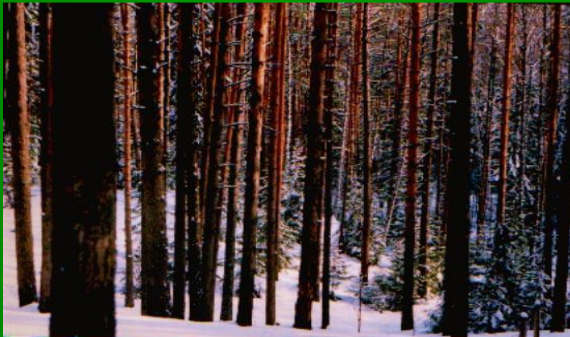
МОУ "Красногорская СОШ №2" Марий Эл, п.

В рельефе преобладают равнины, хотя их поверхность разная на западе и востоке территории парка. В западной её части равнины сложены мощной толщей песчаных отложений, нанесенных реками и талыми водами ледника.