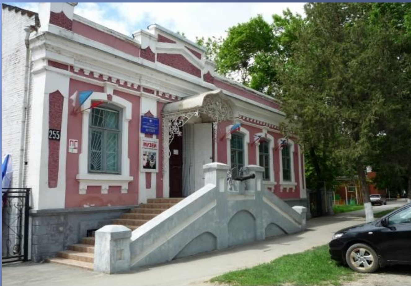
Славянский историко-краеведческий музей, 1976 г.