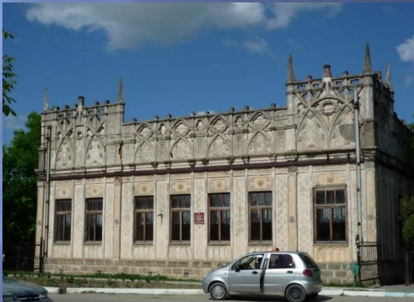
Детская художественная школа, 1970 г.