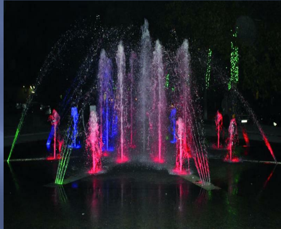
Фонтан и повозка с иллюминацией, расположенные по ул. Красной, 2010 г.