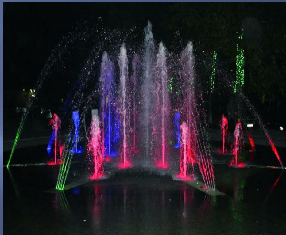
Фонтан и повозка с иллюминацией, расположенные по ул. Красной, 2010 г.