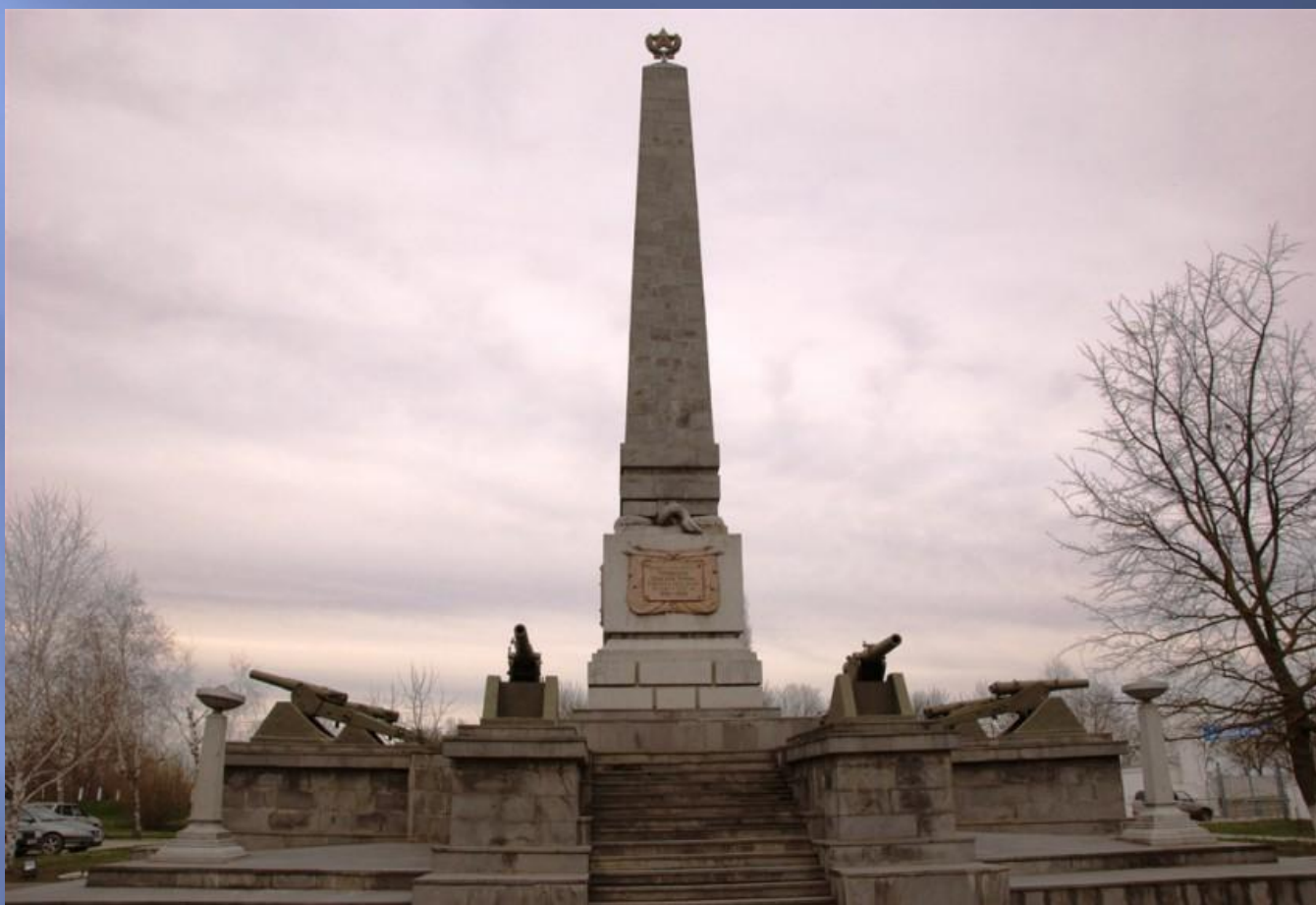
Памятник участникам Таманского похода, 1923 г.