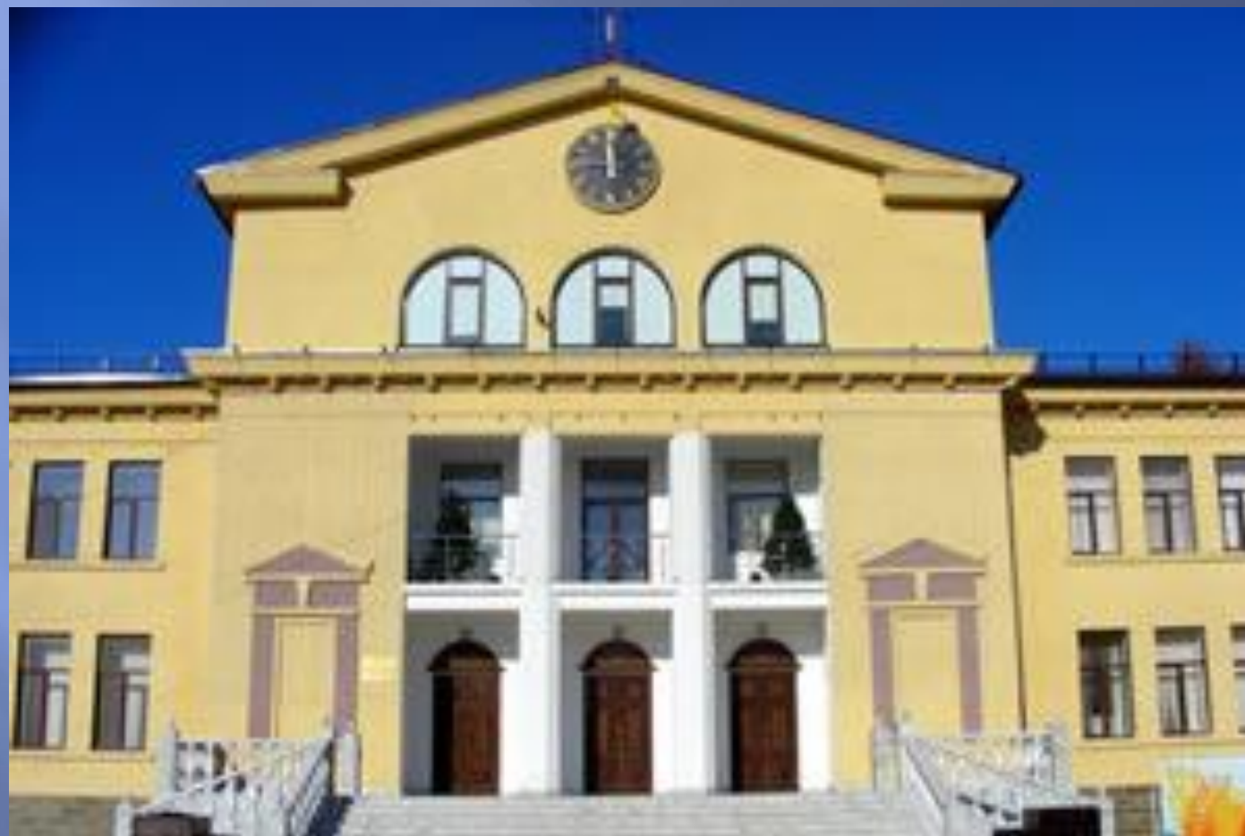
Городской дом культуры, 1958 г.