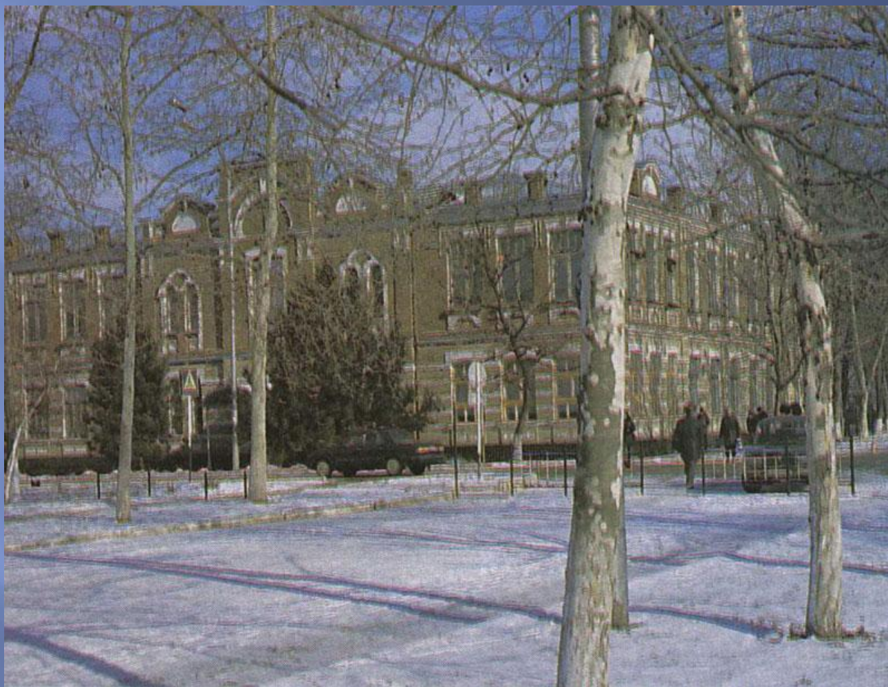
Детская школа искусств им. Г. Ф. Пономаренко, 1962 г.