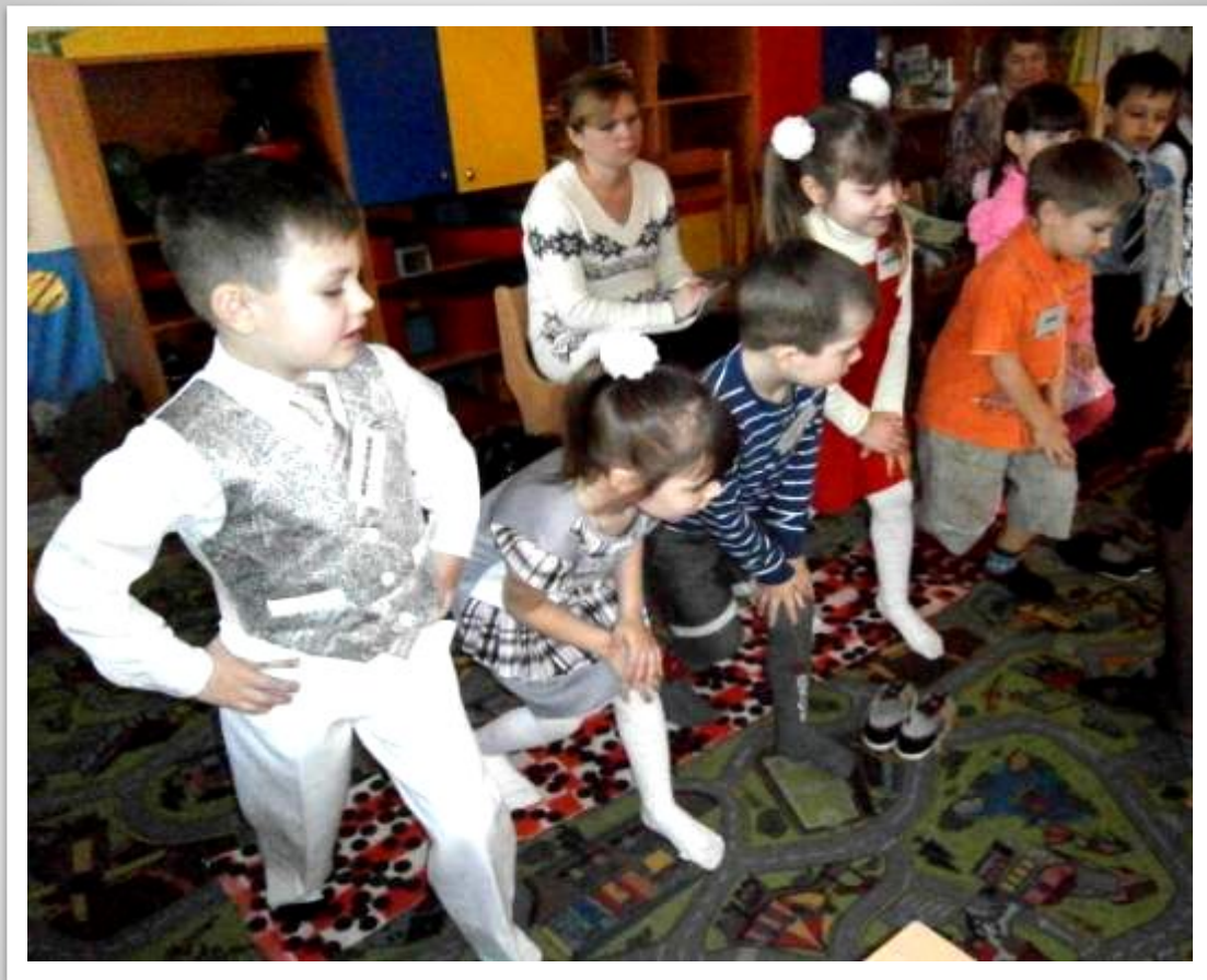
Физкультминутка на дорожке из пуговиц.