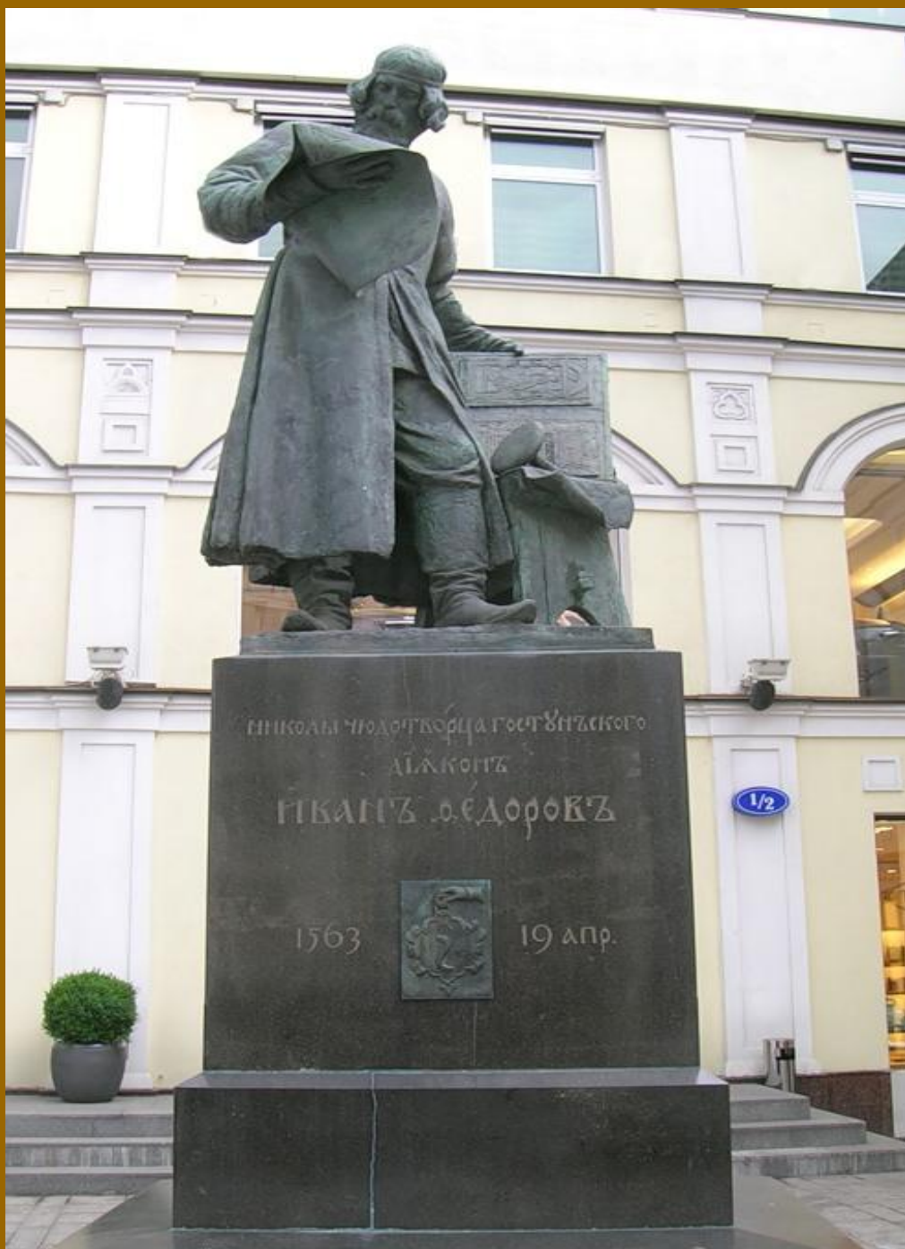
Памятник первопечатнику Ивану Фёдорову